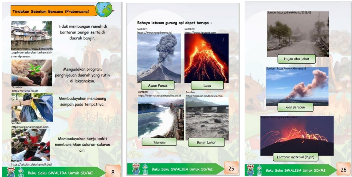
Gambar 4.4 Sudah dicantumkan sumber disetiap gambar di dalam buku