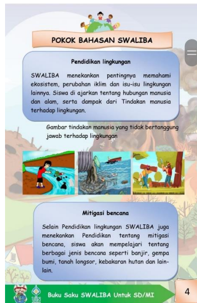
Gambar 4.1 Background terlalu berwarna

Sesuai dengan kritik serta saran yang telah diberikan oleh validator mengenai buku saku SWALIBA pada siswa SD/MI kelas V, peneliti melakukan revisi untuk memperbaiki kesalahan serta kekurangan yang ada di buku saku SWALIBA.