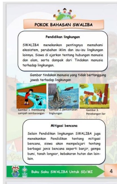
Gambar 4.2 Materi Sudah Jelas dan Background Sudah Diperbaiki