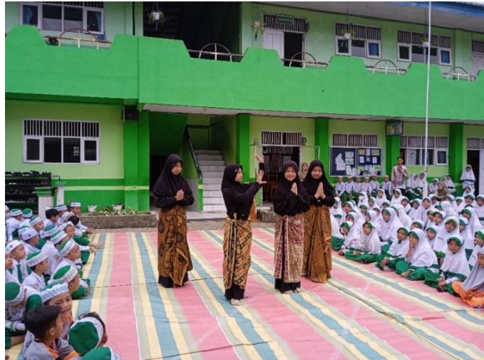
Penampilan Bakat Menari oleh Siswi Kelas V B