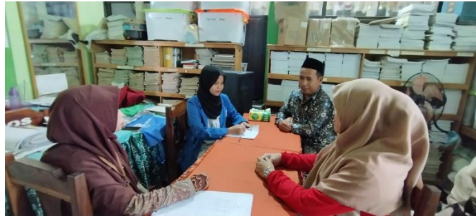
Wawancara dengan Wali Kelas VIA, VIB, VIC