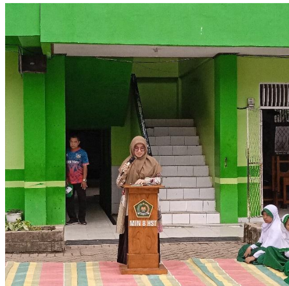
Pengumuman Nilai oleh Guru Pembimbing