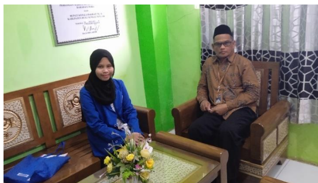
Wawancara dengan Kepala MIN 8 Hulu Sungai Tengah