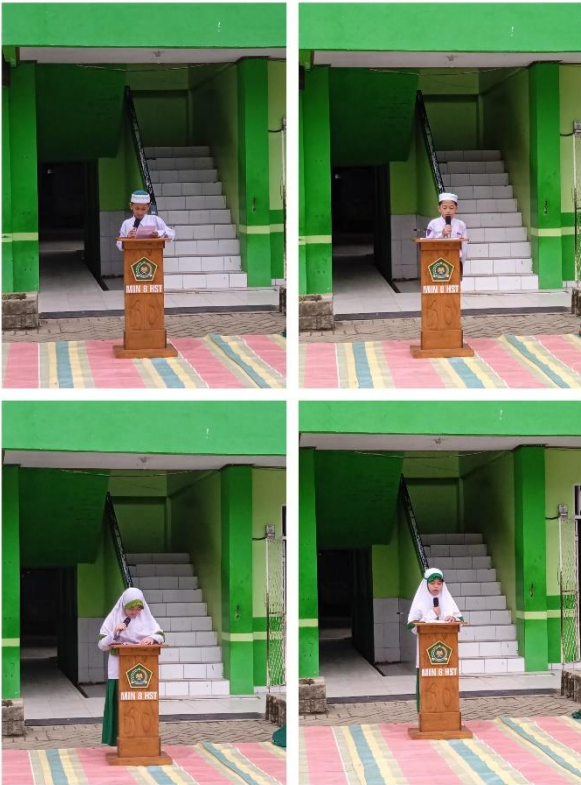
Latihan Pidato oleh Siswa-Siswi Kelas VI