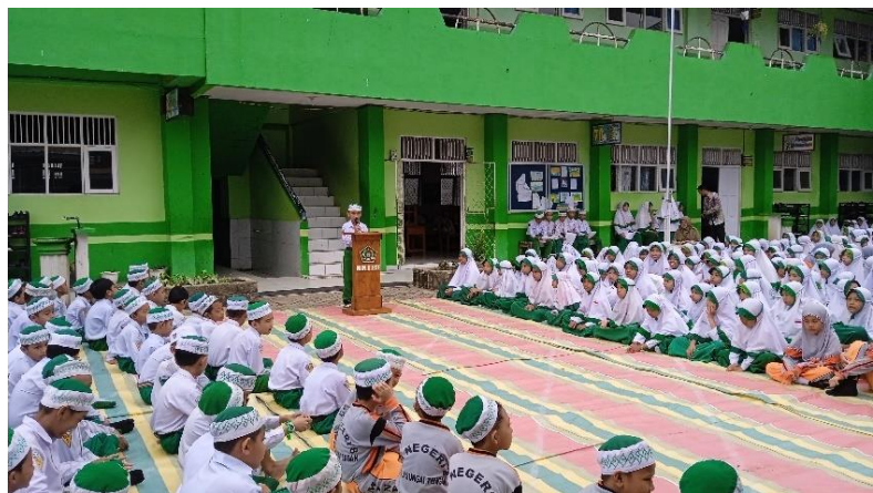
Pembacaan Ayat Suci Al-Qur'an