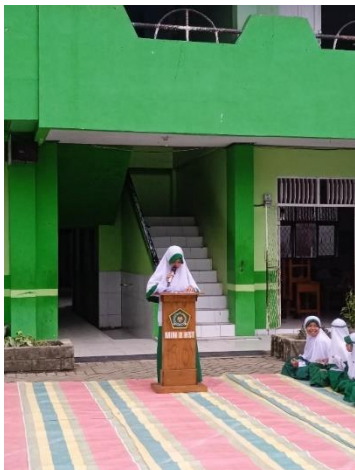
MC atau Pembawa Acara