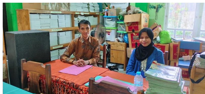
Wawancara dengan Guru Pembimbing Muhadharah