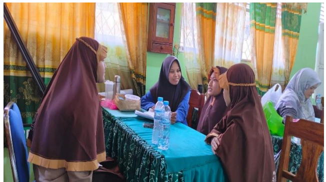
Wawancara dengan Siswa Kelas VIA, VIB, VIC