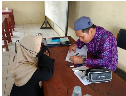
Gambar. 4.3 Siswa setoran hasil tulisan kepada guru