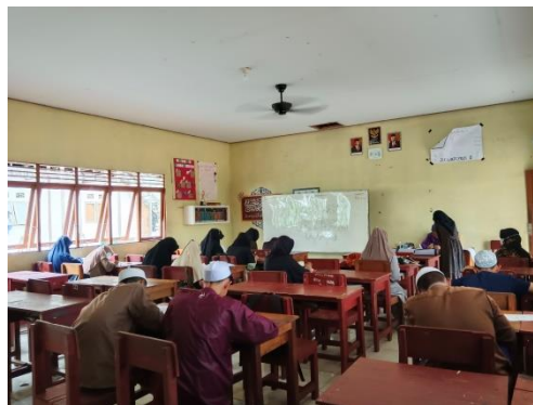
Gambar. 4.1 Suasana kegiatan pembelajaran ekstrakurikuler kaligrafi Al-Qur'an di Madrasah Aliyah Ulumul Qur'an