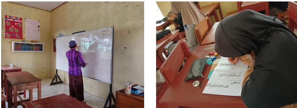
Gambar. 4.2 Guru menuliskan contoh kaligrafi di papan tulis