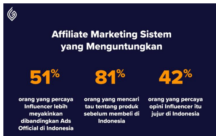
Gambar 1. 3 Pengaruh Affiliate Marketing terhadap keputusan pembelian

Dengan pengaruh ini cukup menjadi alasan di Indonesia untuk membuat program Affiliate Marketing . Berikut data yang menunjukkan affiliate marketing berpengaruh pada keputusan pembelian.