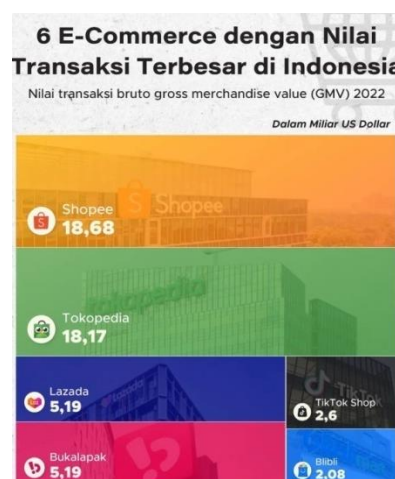
Gambar 1. 4 E-Commerce dengan Nilai Transaksi Terbesar di Indonesia

Keputusan pembelian merupakan salah satu bagian terpenting dalam mempertahankan pelanggan. Bisnis bertujuan menciptakan rasa puas pada pelanggan agar terciptanya keputusan pembelian, Hal ini memberikan manfaat, untuk hubungan perusahaan dengan pelanggan menjadi harmonis, memberikan dasar yang baik bagi pelanggan untuk melakukan pembelian ulang. Diharapkan dari keputusan pembelian ini akan berlanjut kepada kepuasan pembelian yang memberikan rekomendasi yang baik dari mulut ke mulut. Dengan gencarnya aplikasi shopee menggunakan pemasaran afiliasi sebagai sarana promosi menjadi salah satu kegiatan yang memberikan manfaat terhadap keputusan pembelian.