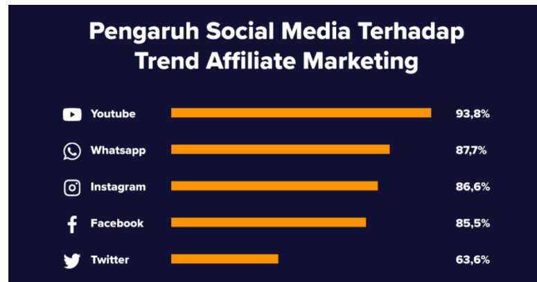
Gambar 1. 2 Pengaruh sosial media terhadap trend affiliate marketing