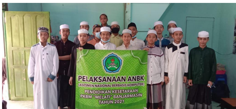
GAMBAR 4.7 Program Kegiatan Umum Pelaksanaan ANBK