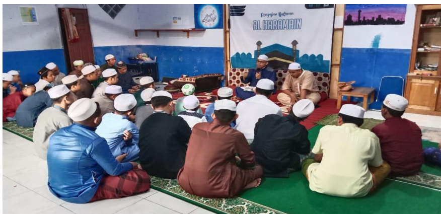
GAMBAR 4.8 Program Kegiatan Ekstrakurikuler Ceramah Agama