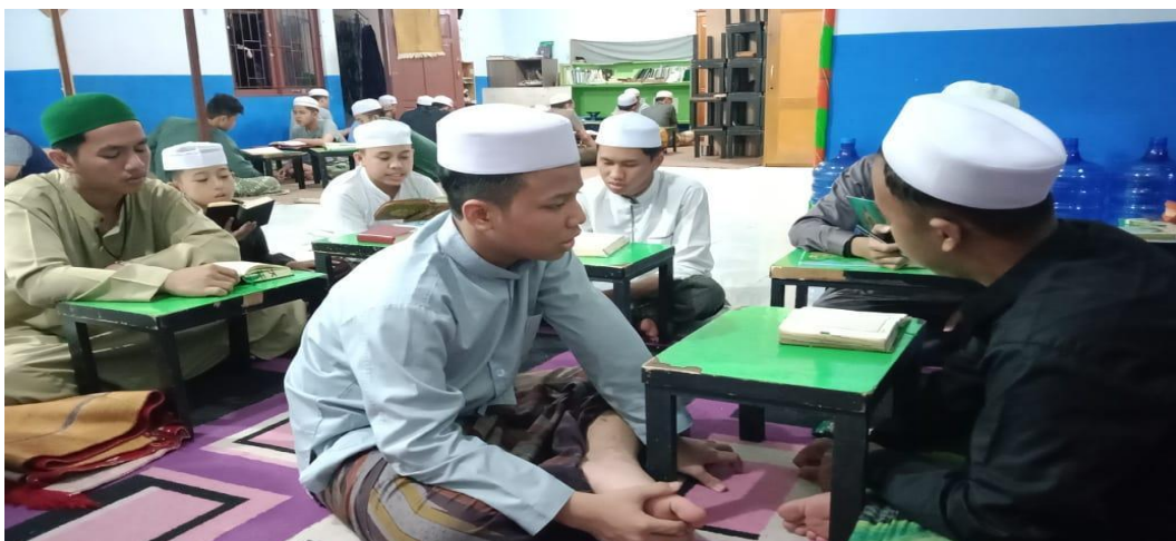
GAMBAR 4.12 Program Kegiatan Menghafal Pondok Tahfidzul Qur'an Al Haramain Metode Privat/Individual