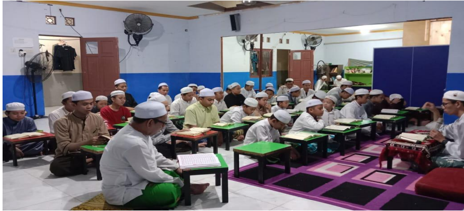
GAMBAR 4.6 Program Kegiatan Penunjang Belajar Kitab