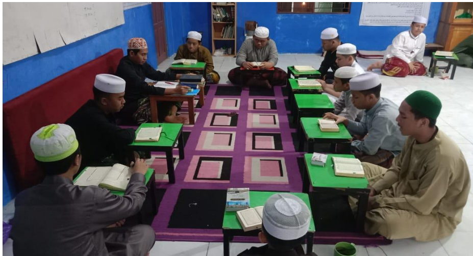
GAMBAR 4.5 Program Kegiatan Tahfidzul Qur'an