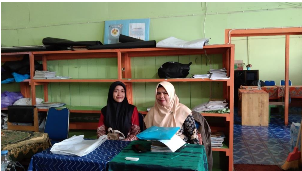
Foto Bersama Wali Kelas 7D MTsN 2 Banjarmasin