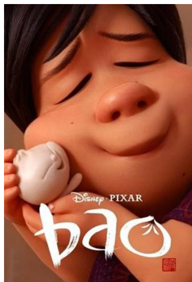
Gambar 1.2 Poster Film Bao

Animasi pendek Bao merupakan sebuah animasi pendek berdurasi 8 menit yang dirilis pada tanggal 15 Juni 2018. Film ini disutradarai oleh Domee Shi dan diproduksi oleh Pixar Animation Studios. Animasi ini berlatar belakang di Toronto, Kanada dan menampilkan sebagai Landmark kota tersebut. Animasi ini menceritakan tentang seorang ibu keturunan Cina yang menderita Empty Nest Syndrome atau suatu kondisi psikologis yang memengaruhi orang tua. Kondisi ini sering terjadi pada seorang ibu yang untuk pertama kalinya berjauhan dengan anak-anaknya sehingga menderita kesepian yang dalam. Ibu tersebut sudah tua dan merasa sangat kesepian di rumah, namun berkesempatan kembali menjadi ibu ketika salah satu dimsum buaatannya berubah menjadi seperti bayi manusia.