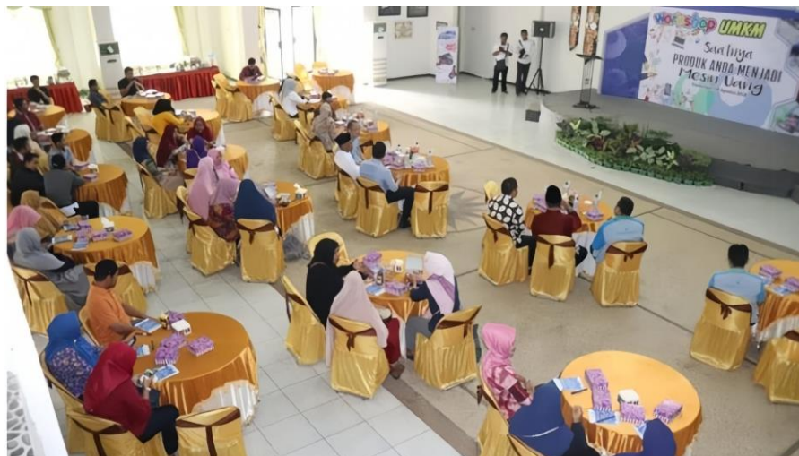
Gambar 4.4 Kegiatan Workshop Bagi UMKM

Dokumentasi di atas adalah Kegiatan Workshop bagi puluhan UMKM, untuk meningkatkan hasil produksi, mengatur usahanya agar berkesinambungan dan terus berkembang.