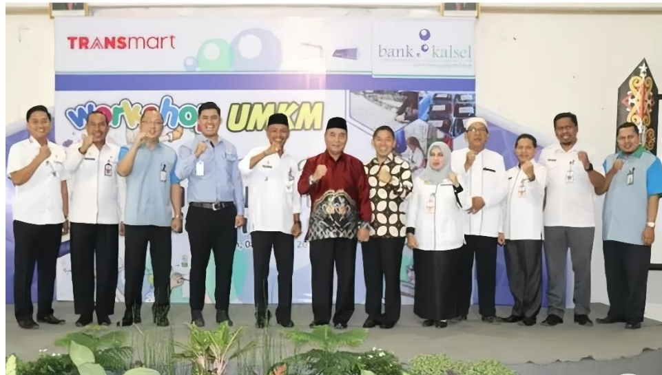
Gambar 4.2 Foto Bersama Bupati HSS