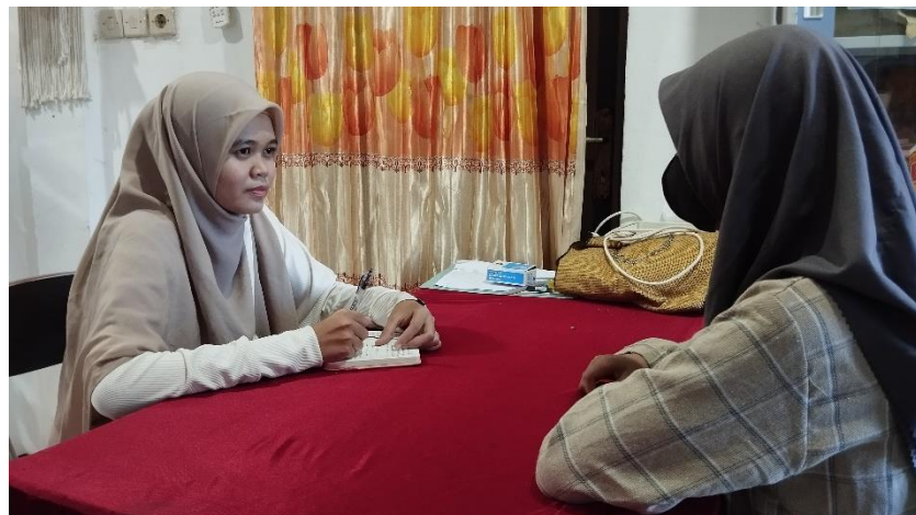
Wawancara pribadi bersama anak pungut, M (11/05/2024)