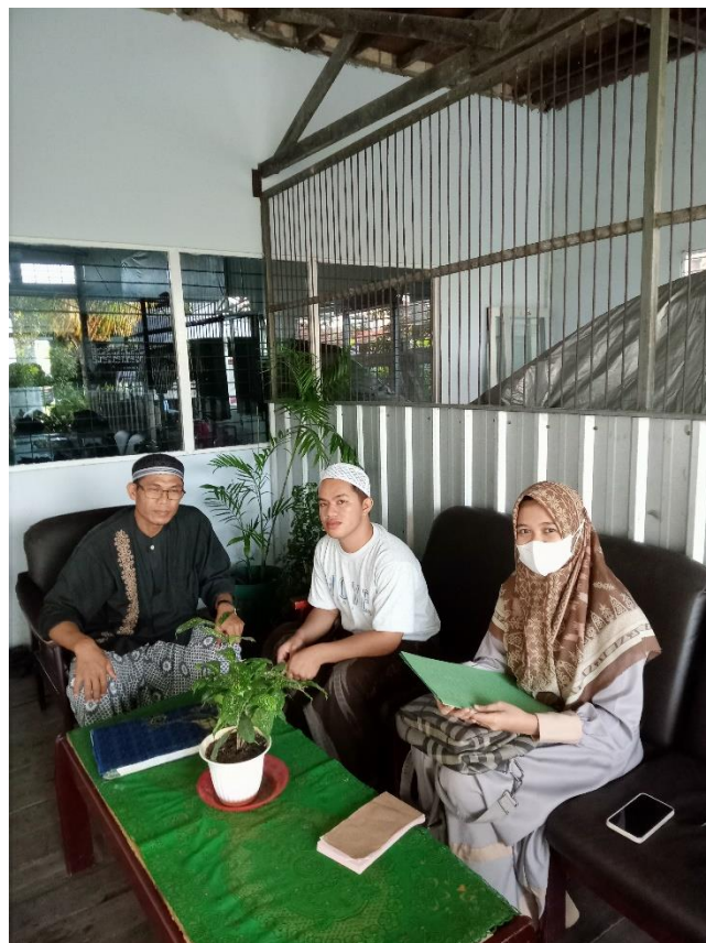
Wawancara pribadi bersama bapak A dan bapak Am (08/05/2024)