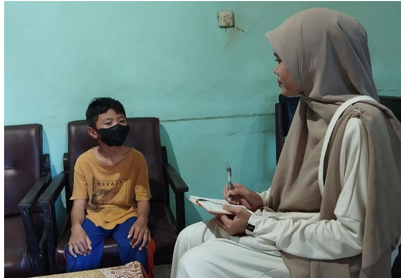
Wawancara pribadi bersama anak pungut, S (08/05/2024)