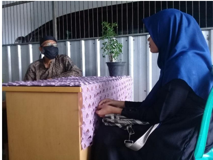
Wawancara pribadi bersama bapak A (02/01/2022)