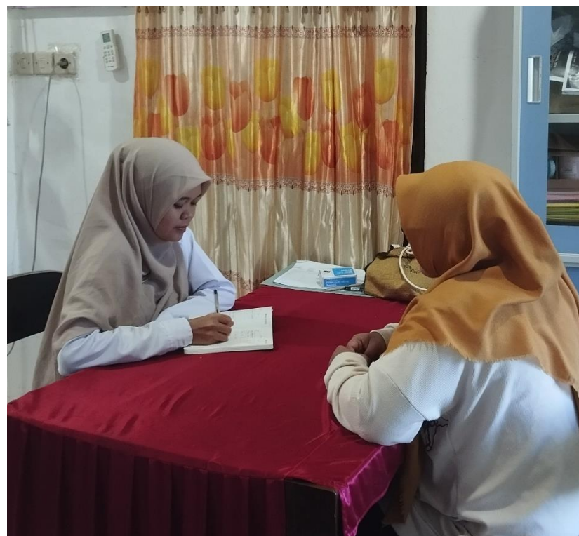
Wawancara pribadi bersama ibu Hk (11/05/2024)