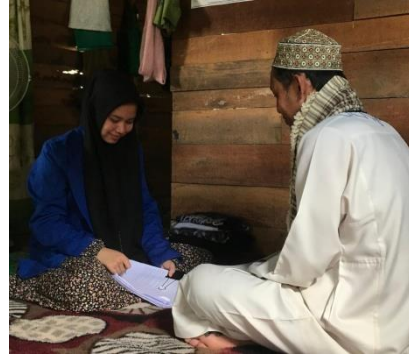
Wawancara dengan MS