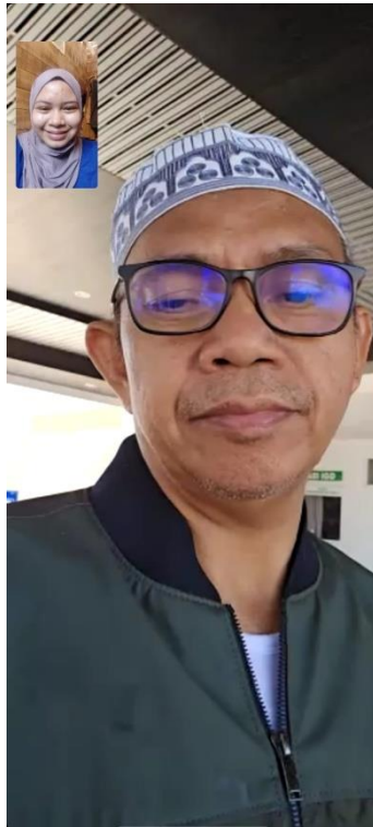
Wawancara dengan AH