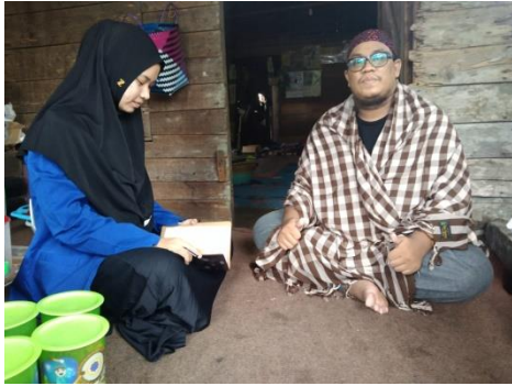
Wawancara dengan MH