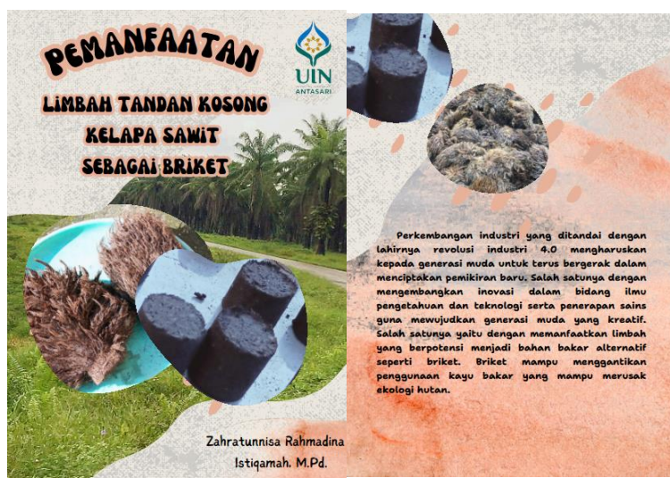
Gambar 3.4 Cover Final Buku Ilmiah Populer

Dengan melalui tahapan uji pakar ( expert review ) dan revisi yang sesuai dengan saran yang diberikan, BIP prototipe final menjadi lebih siap untuk proses validasi. Proses ini bertujuan untuk memastikan bahwa buku ilmiah populer yang dikembangkan mampu memberikan data yang valid dan akurat bagi pembaca, serta dapat bermanfaat dalam meningkatkan pengetahuan dan pemahaman materi yang dibahas.