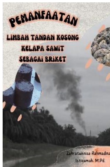
Gambar 3.1 Cover Buku Ilmiah Populer Rancangan Penelitian

( self-evaluation ), peneliti mengadopsi dan memodifikasi instrumen validasi yang nantinya akan digunakan oleh ahli pakar untuk memberikan penilaian yang konstruktif terkait desain BIP. Evaluasi diri ini bertujuan untuk memastikan kelengkapan isi dan spesifikasi dari desain BIP prototipe 1. Adapun desain sampul BIP prototipe 1 adalah sebagai berikut: