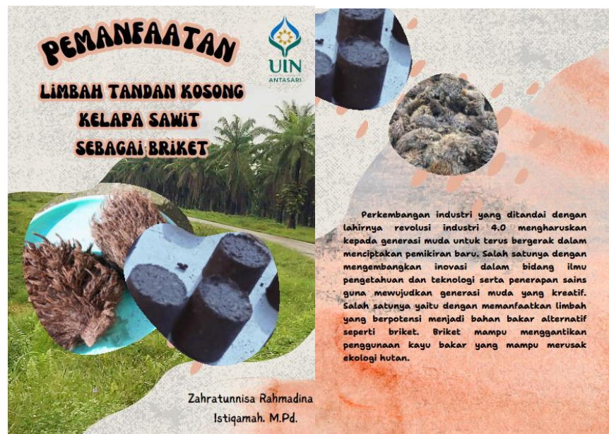
Gambar 3.2 Cover Final Buku Ilmiah Populer

Melalui validasi yang cermat dan terstruktur seperti ini, diharapkan buku ilmiah populer yang disusun mampu menyajikan data yang valid, bahkan sangat valid dan akurat bagi pembaca. Harapannya, karya ini akan memberikan kontribusi yang signifikan dalam meningkatkan pengetahuan dan pemahaman tentang materi yang dibahas. Selain itu, desain penelitian yang mengadopsi model Plomp dapat direpresentasikan dalam diagram alur tahap pengembangan model Plomp seperti yang ditunjukkan di bawah ini: