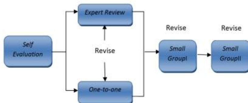
Gambar 3.4 Alur Desain Formative Evaluation Sumber: Zaini, 2018