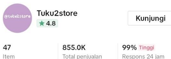
Gambar 1. 1 Rating Toko

Fitur kedua yang juga menarik banyak perhatian para konsumen, yaitu fitur Ulasan Konsumen, dimana konsumen dapat memberikan ulasan mereka