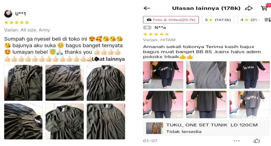
Gambar 1. 2 Ulasan Konsumen

Selain itu juga, kualitas produk sangat penting dalam menarik minat beli konsumen, karena pada dasarnya setiap orang yang ingin membeli suatu produk ingin mendapatkan kualitas produk yang baik dari produk yang mereka beli