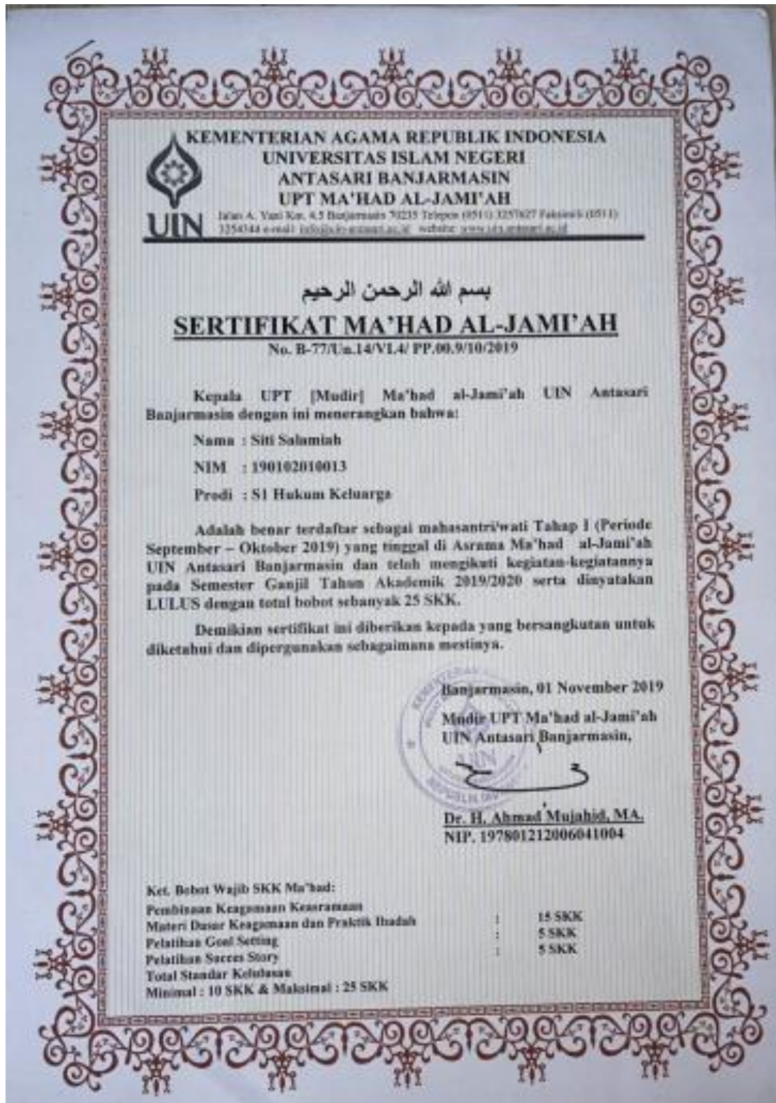
Lampiran 13 Sertifikat Ma'had al-Jami'ah