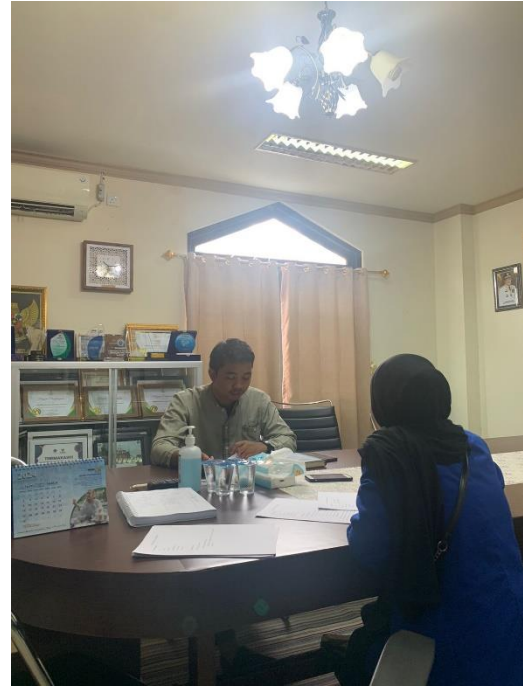
Kondisi BAZNAS Provinsi Kalimantan Selatan