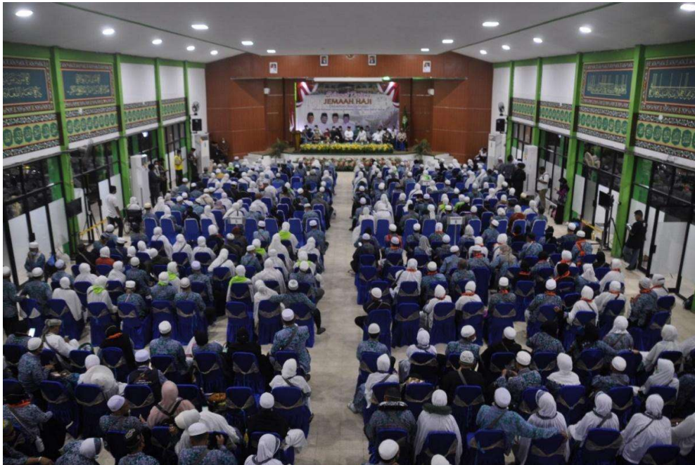
Gambar.8 kepulangan atau kedatangan jemaah haji tahun 2022