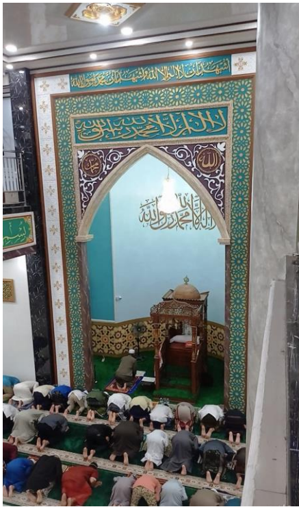
Foto Kegiatan Tradisi Maayat Al-Qur'an dan Masjid Jami Al-Karamah tampak depan.