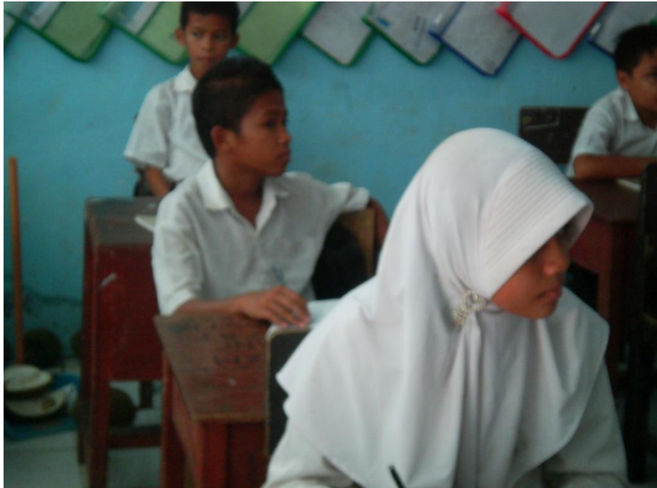
Foto : Siswa memperhatikan guru yang menjelaskan materi dan cara penggunaan kartu