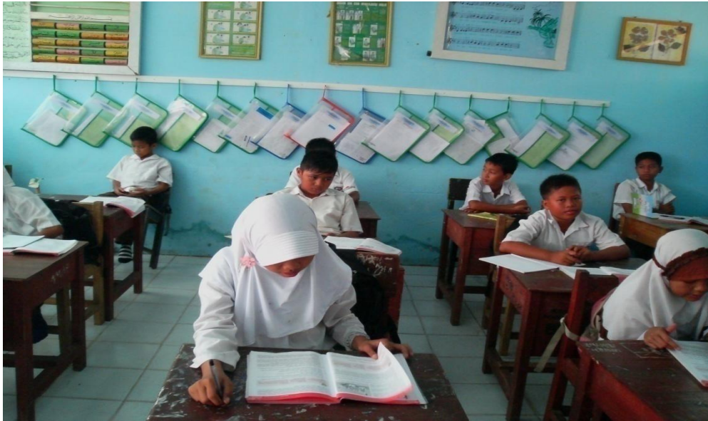
Foto : Siswa mendengarkan penjelasan dari guru tentang cara belajar SKI menggunakan teknik make a match .