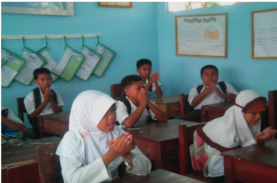
Foto : Siswa dan guru mengawali pembelajaran dengan membaca doa dan apersepsi