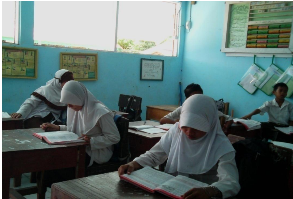
Foto : Siswa membaca buku sebelum guru menjelaskan pembelajaran