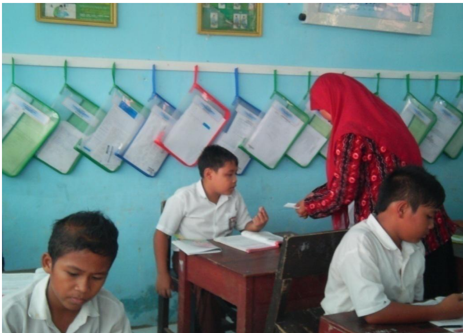
Foto : Guru membagikan kartu pada siswa yang