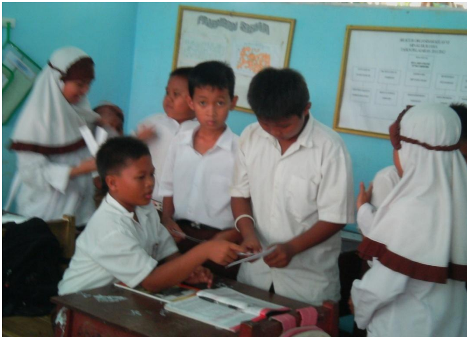
Foto : Siswa mencari pasangan dari kartu yang dimiliki