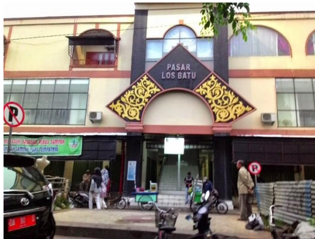
Gambar 4.1 Pasar Los Batu Kandangan