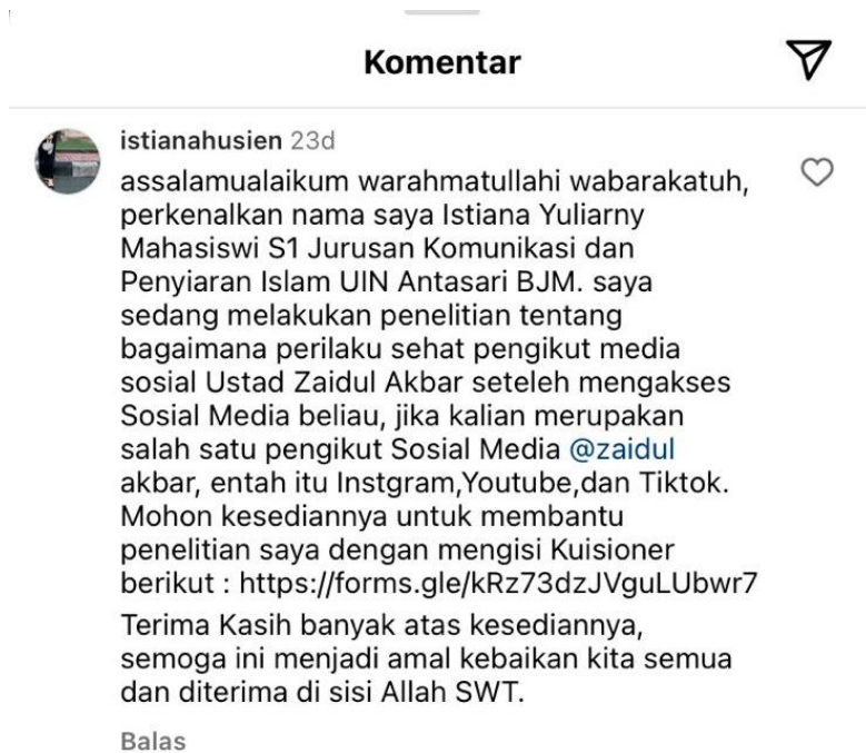
Gambar 3.2 Penyebaran Kuisisioner melalui Kolom Komentar Akun Youtube Ustadz Zaidul Akbar