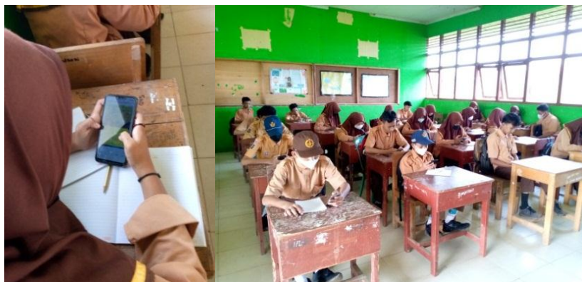
Gambar 4.1 Pelaksanaan Post-Test Menggunakan Fyrebox di Kelas Eksperimen

Pelaksanaan post-test berlangsung tanpa terkendala sampai jam pelajaran kedua hampir habis. Guru mengecek siapa saja yang sudah menyelesaikan post-test melalui akun Fyrebox milik guru. Setelah semua siswa selesai mengerjakan soal, guru membagikan angket untuk diisi oleh siswa. Setelah mengisi angket, siswa mengumpulkan kembali angket yang telah mereka isi.