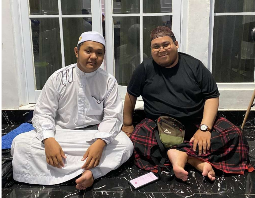
Lampiran 4 Live Streaming di Channel YouTube Majelis Ta'lim Syekh Maulana Arsyad Al-Banjari