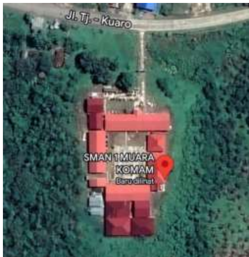
Gambar 3.2 Letak Geografis SMAN 1 Muara Komam

RMS materi asam basa pada peserta didik kelas XI semester genap tahun ajaran 2022/2023 di SMAN 1 Muara Komam. Berikut dapat dilihat pada Gambar 3.2 menunjukkan letak geografis SMAN 1 Muara Komam.