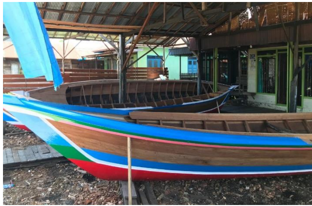
Jukung Ukuran 11 Meter