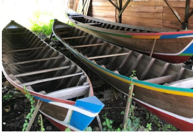
Jukung Ukuran 8 meter