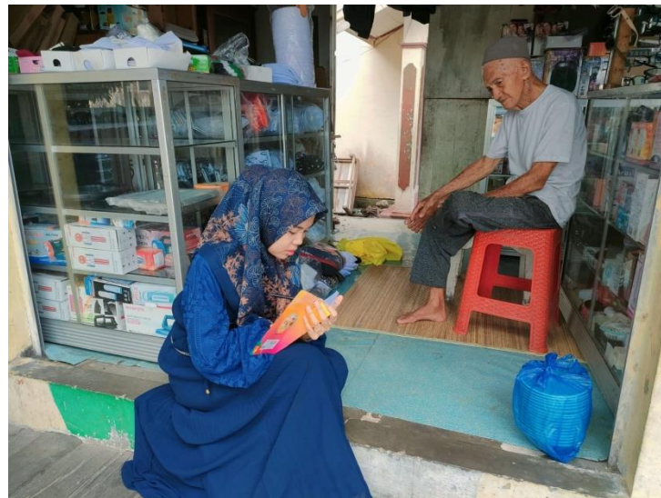
Wawancara Bersama Pedagang