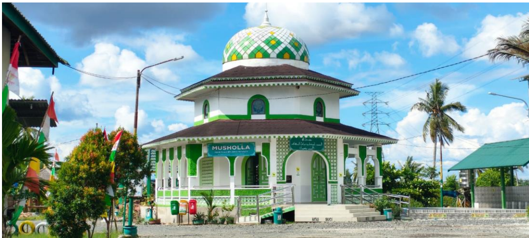
Mushola Habib Hamid bin Abbas Bahasyim