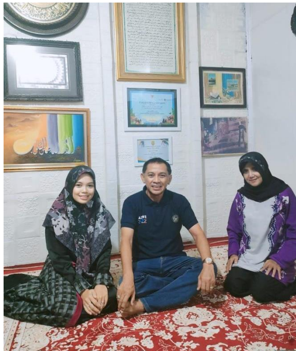
Bersama dengan Kepala Pokdarwis Kubah Basirih