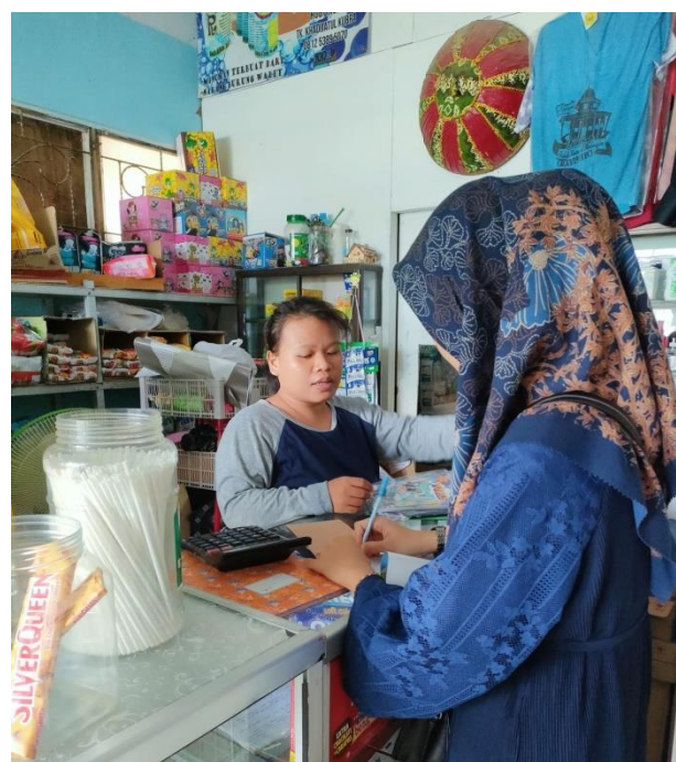
Wawancara Bersama Pedagang