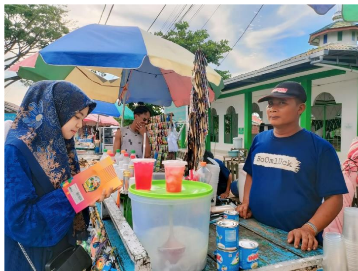
Wawancara Dengan Pedagang