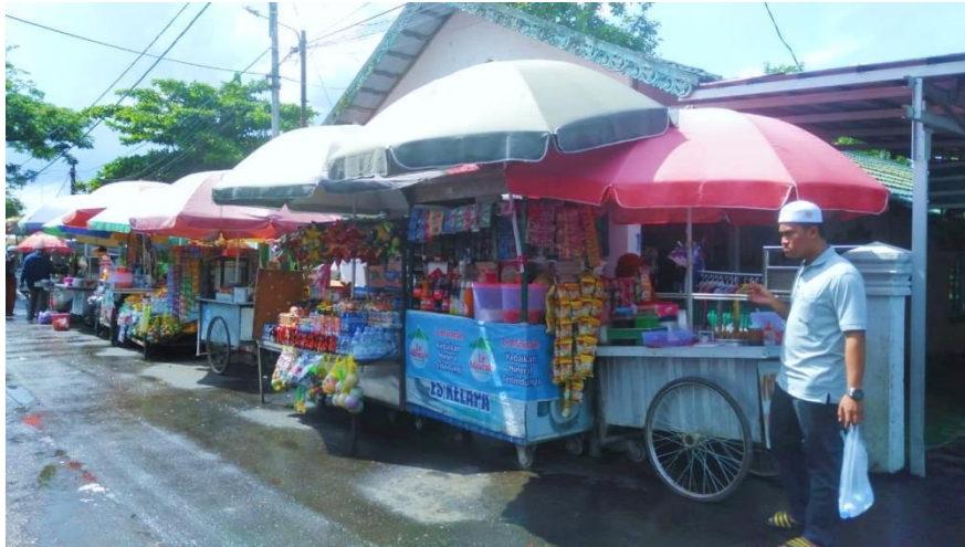
Suasana Tempat berjualan Para Pedagang di Kubah Basirih