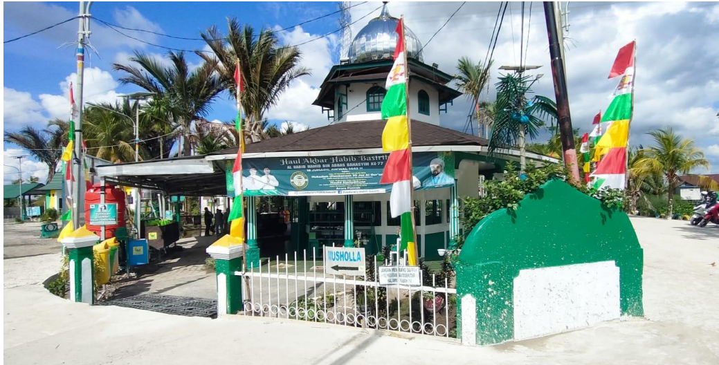
Kubah Habib Hamid bin Abbas Bahasyim