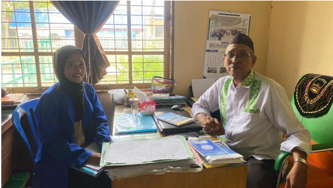
Gambar 3. Wawancara Bersama Kepala KUA Banjarmasin Barat