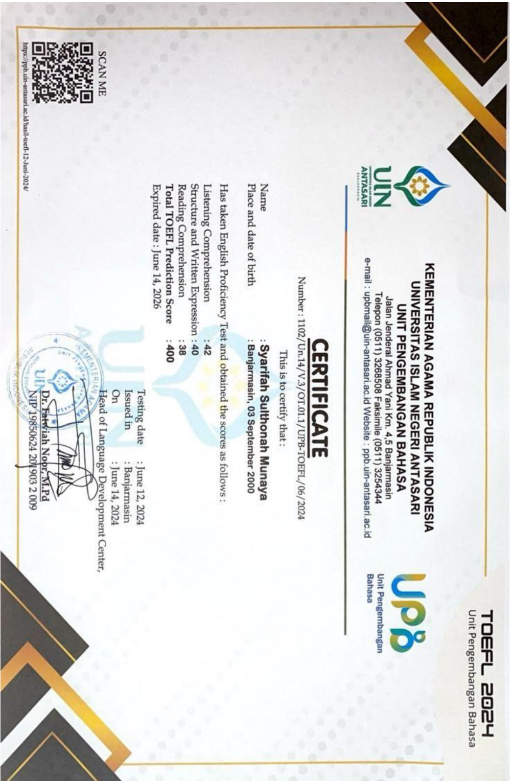
Lampiran 7: TOEFL