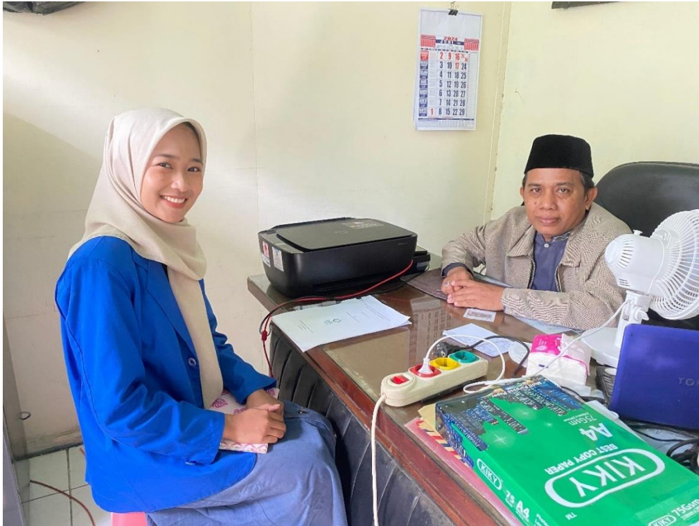
Gambar 1. Wawancara bersama Kepala KUA Kecamatan Alalak