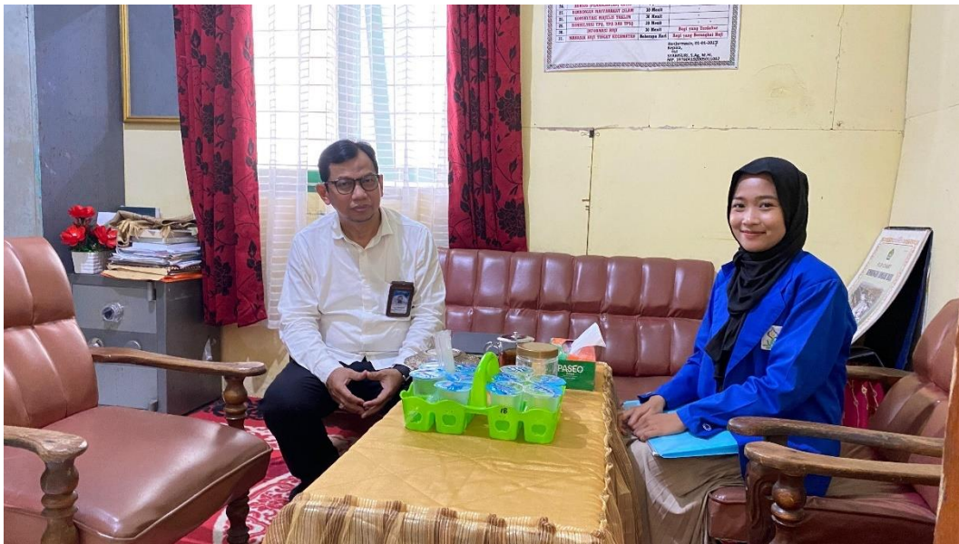
Gambar 2. Wawancara Bersama Kepala KUA Banjarmasin Utara