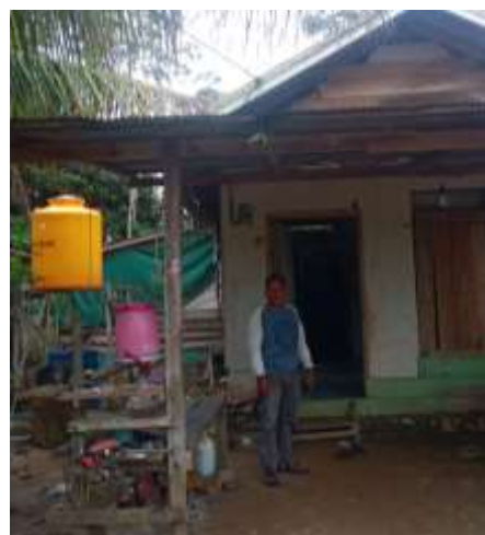
Rumah warga Desa Karya Bersama