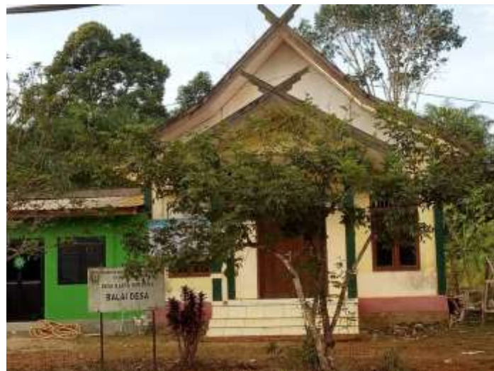
Kantor Desa Karya Bersama