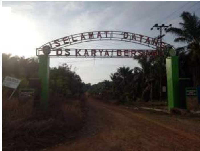
Gapura/gerbang Desa Karya Bersama