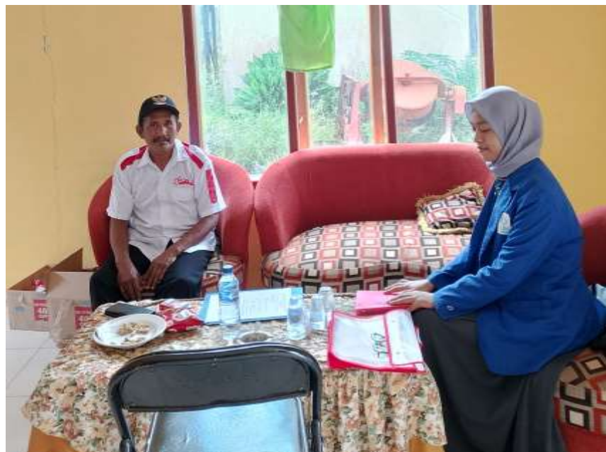
Wawancara bersama Sekretaris Desa Karya Bersama