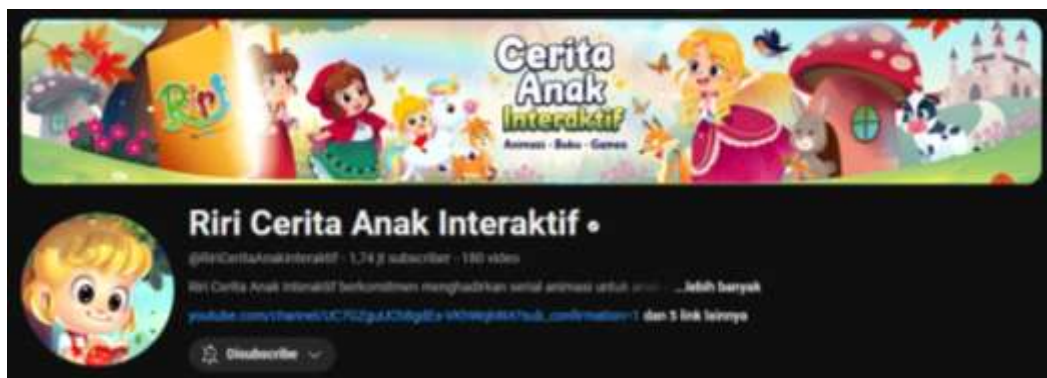
Gambar 1. 2 Profil Channel Riri Cerita Anak Interaktif

Terdapat banyak channel YouTube yang mengunggah video-video tentang cerita rakyat nusantara, diantaranya adalah channel YouTube Gromore Studio Series dan Riri Cerita Anak Interaktif. Gromore Studio Series merupakan channel yang didalamnya terdapat cerita-cerita rakyat nusantara yang berasal dari Indonesia dengan video animasi 3D. seperti cerita rakyat Legenda Putri Junjung Buih, Legenda Batu Menangis dan lain sebagainya.