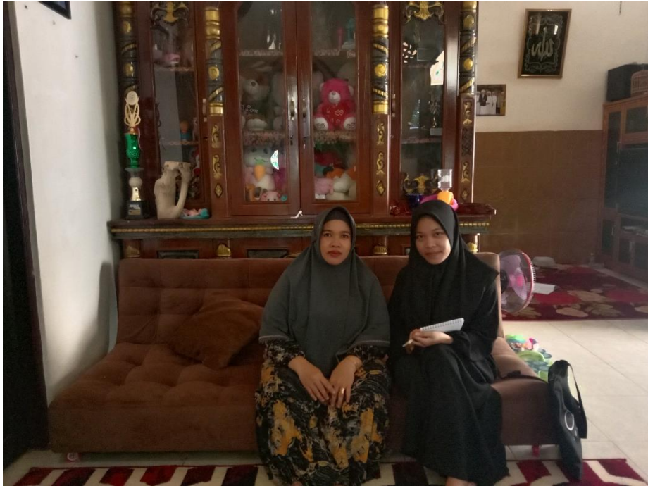
Wawancara dengan Ibu A, Guru Madrasah (20 November 2023)