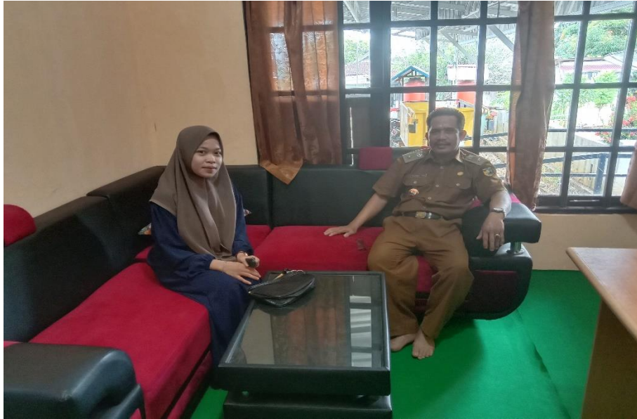
Wawancara dengan Kepala Desa Kuringkit, Bapak NAY di Kantor Desa (pada 8 November 2023)