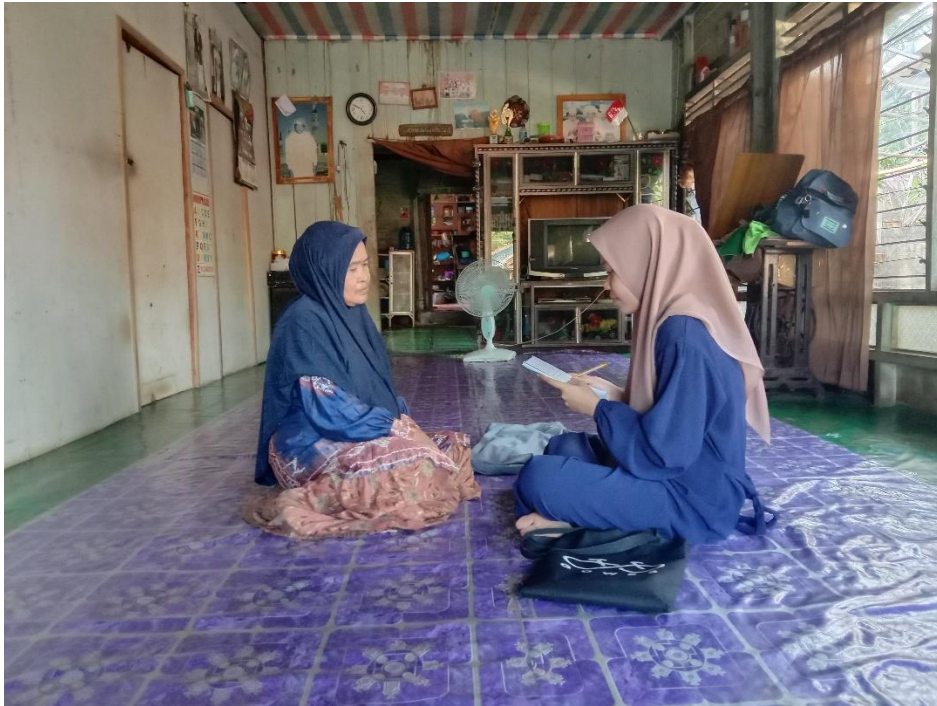
Wawancara dengan Ibu N, Masyarakat Desa Kuringkit (25 November 2023)