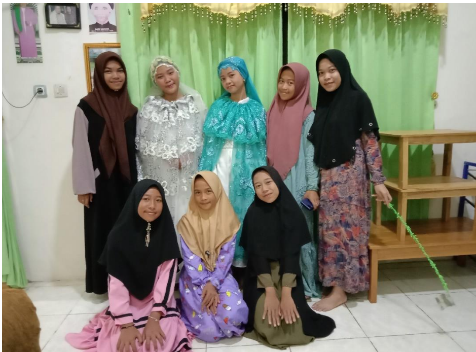
Foto bersama murid yang betamat al-Qur'an dan sebagian murid yang belum betamat al-Qur'an