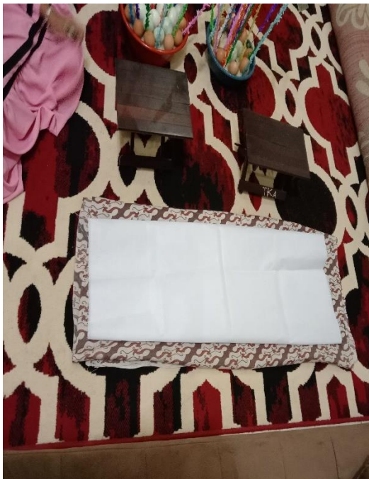
Lapik dan Rehal