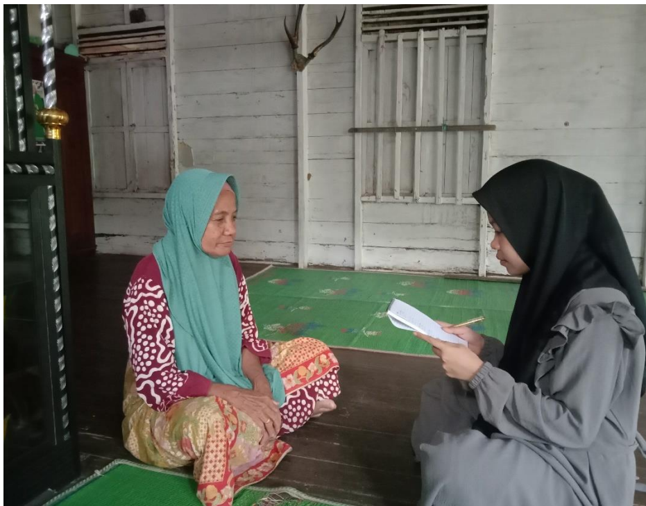
Wawancara dengan Ibu S, Masyarakat Desa Kuringkit (17 November 2023)