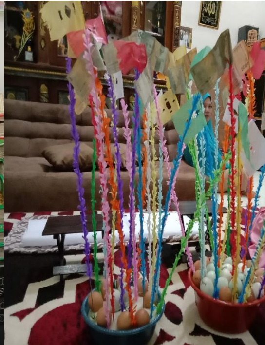
Nasi Ketan, Telur Rebus dan Kembang Serai