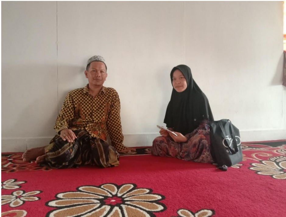
Wawancara dengan Bapak HS, Tokoh Agama di Desa Kuringkit (25 November 2023)