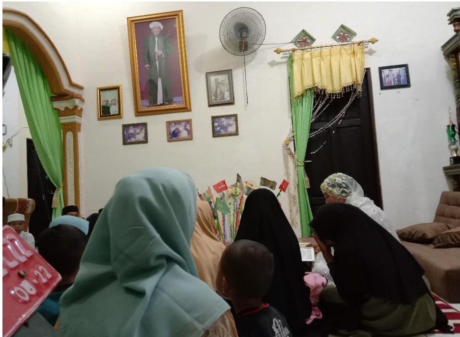
Suasana pelaksanaan tradisi Betamat al-Qur'an di Desa Kuringkit