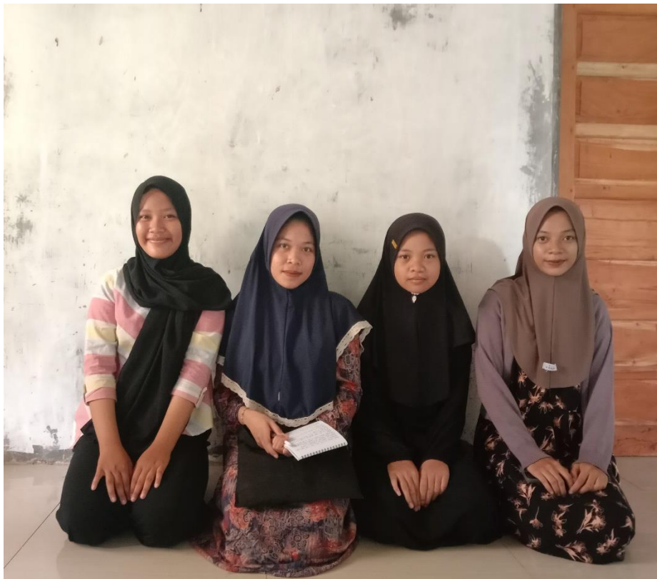
Wawancara dengan FS, Y dan N, murid yang sudah tamat mengaji al-Qur'an, (26 Maret 2024)