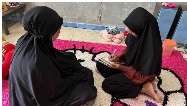
Wawancara Informan FR