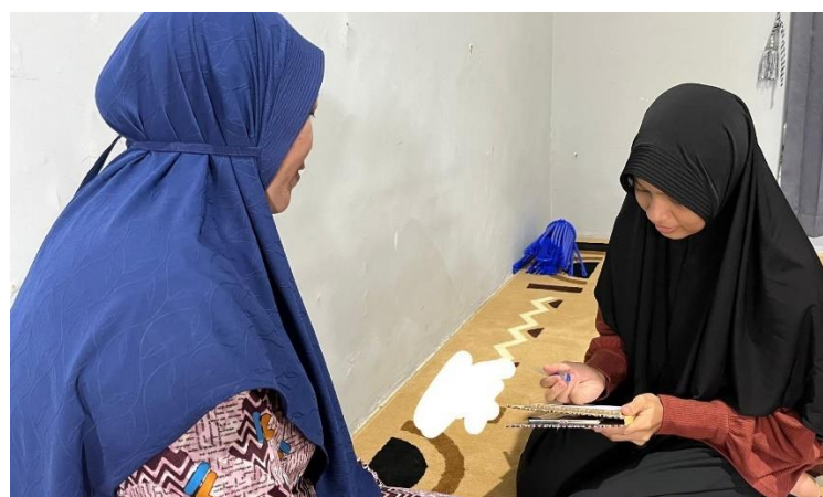
Wawancara Informan RS