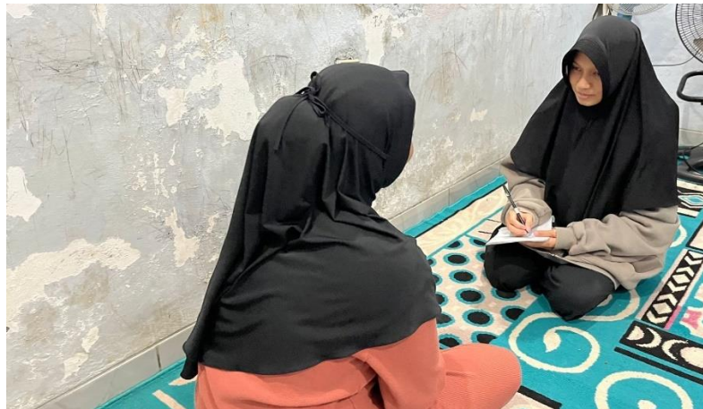
Wawancara Informan SR