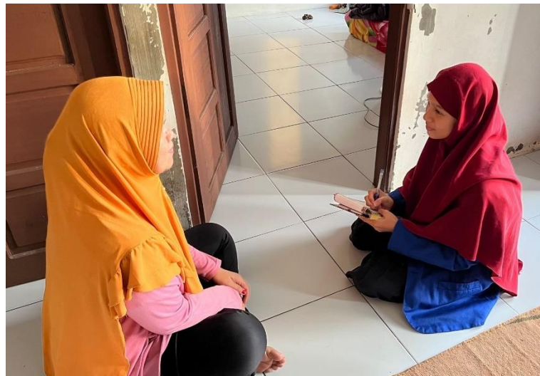
Wawancara Informan JB