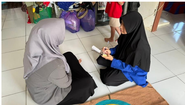
Wawancara Informan MT