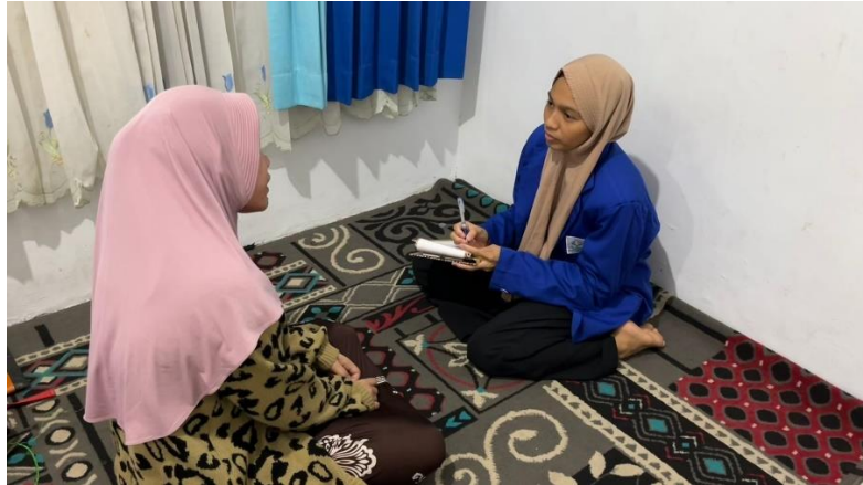
Wawancara dengan Informan D