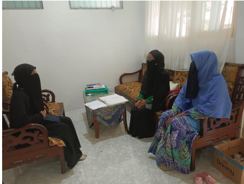
Wawancara dengan guru BK SMK Negeri 1 Gambut