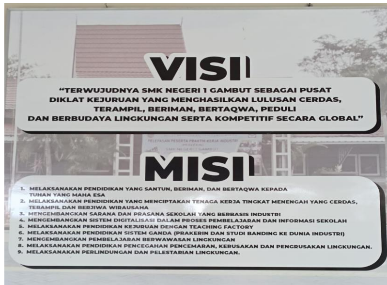
Visi dan Misi SMK Negeri 1 Gambut