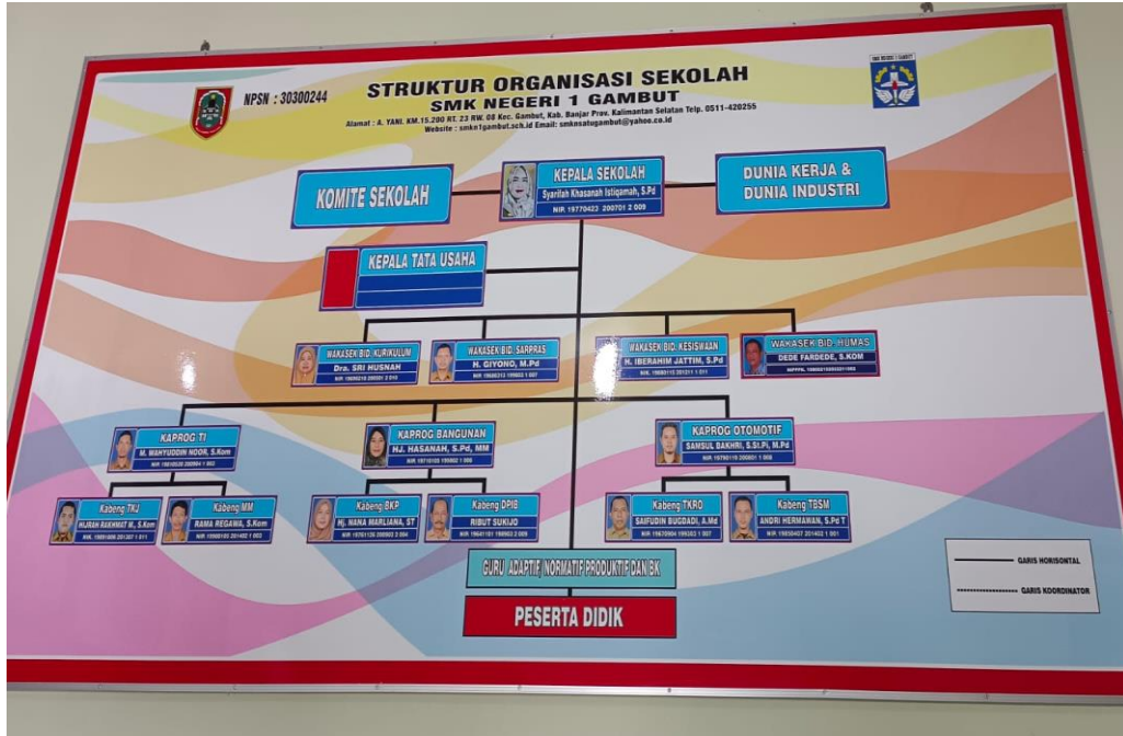
Struktur Organisasi SMK Negeri 1 Gambut