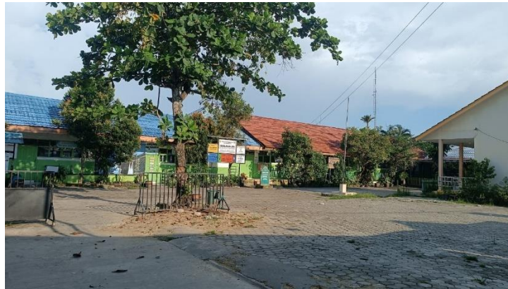
Lampiran 8. SDN Kelayan Dalam 5 Banjarmasin