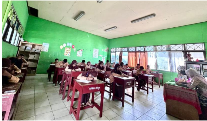
Lampiran 9. Dokumentasi Evaluasi Bimbingan dan Konseling Bidang Belajar di SDN Kelayan Dalam 5 Banjarmasin