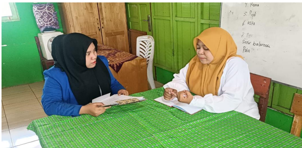
WAWANCARA GURU WALI KELAS VIA