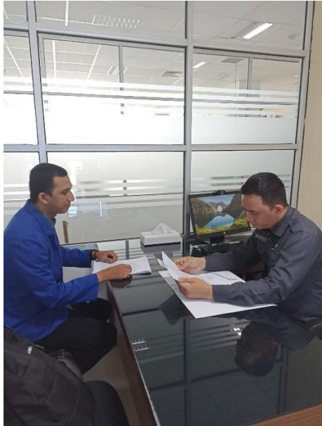
Gambar 1 Permohonan Izin Riset di Badan Pusat Statistik Provinsi Kalimantan Selatan