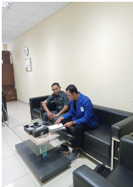
Gambar 2 Penyampaian Mengenai Proposal Penelitian kepada Kepala Bagian Umum di Badan Pusat Statistik Provinsi Kalimantan Selatan