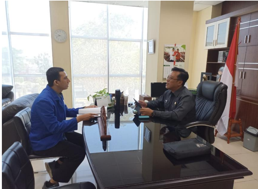
Gambar 3 Penyampaian Proposal Penelitian Kepada Kepala Badan Pusat Statistik Provinsi Kalimantan Selatan