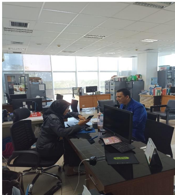
Gambar 4 Penyampaian Mengenai Kuisisioner Penelitian Terhadap Salah Satu ASN di Badan Pusat Statistik Provinsi Kalimantan Selata