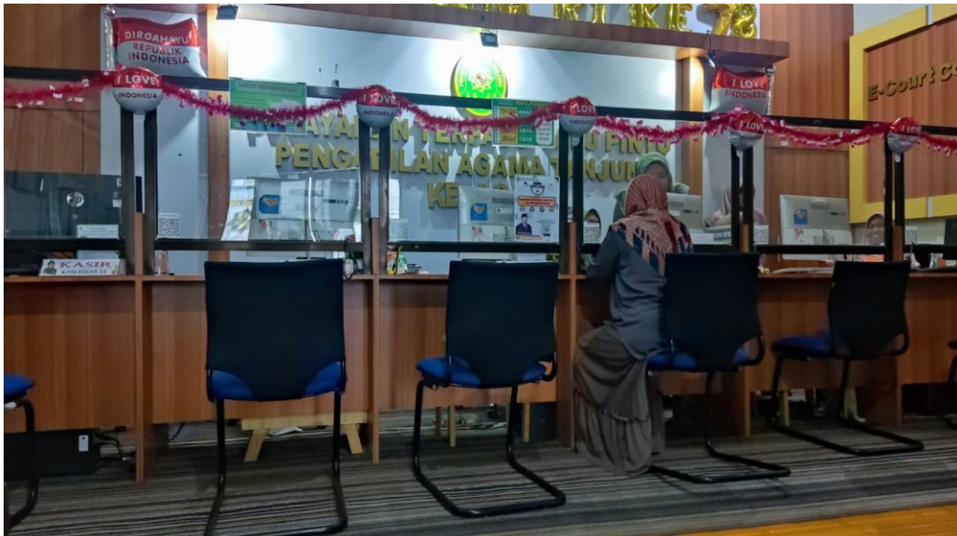
Foto Pengadilan Agama Tanjung