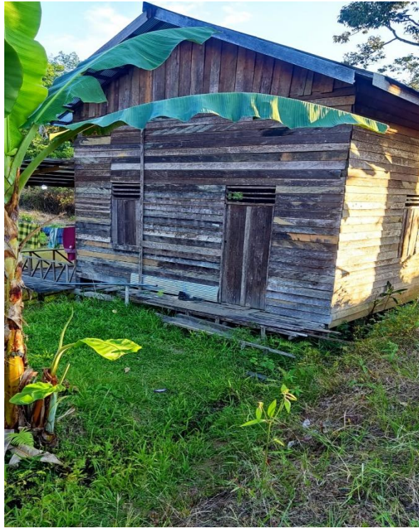
Foto rumah informan Y sekarang