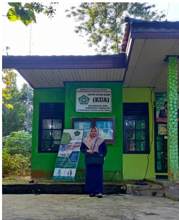
Foto KUA kecamatan Jaro