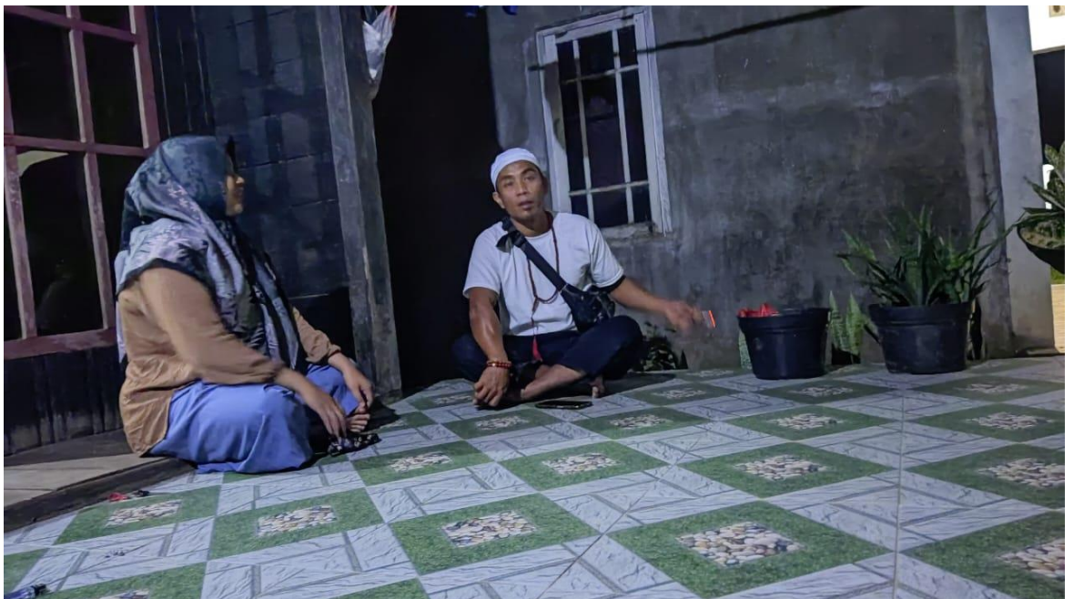
Foto saat wawancara dengan informan Y