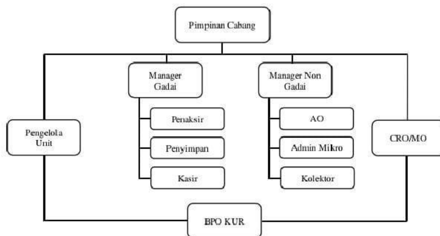
Gambar 4. 2 Struktur Organisasi Perum Pegadaian Syariah Cabang Kebun Bunga Banjarmasin