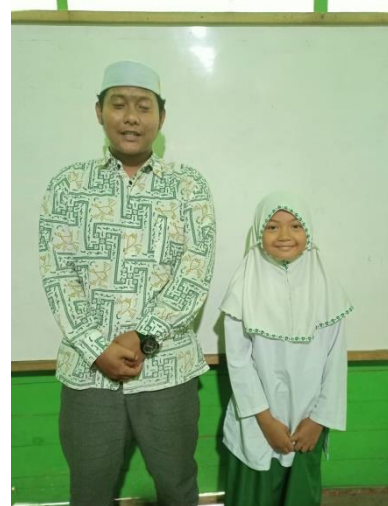
Foto Dokumentasi dengan Siswa Kelas V B MI Nur Rahman Kabupaten Banjar