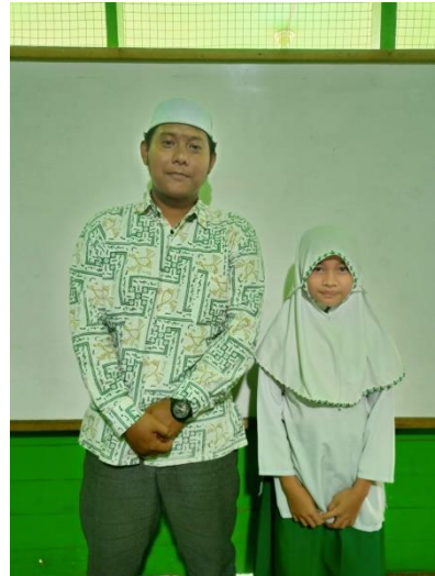
Foto Dokumentasi dengan Siswa Kelas V B MI Nur Rahman Kabupaten Banjar