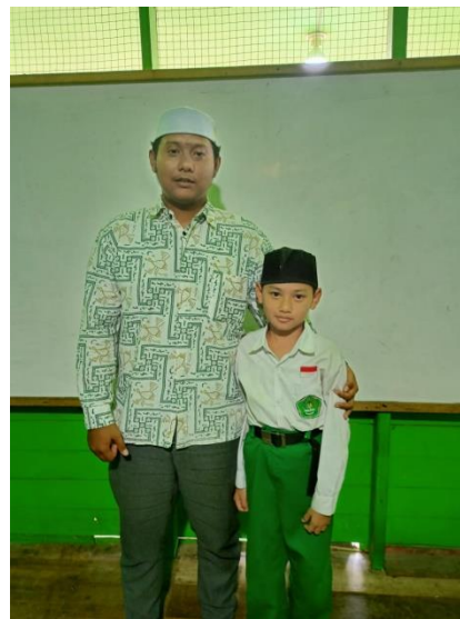
Foto Dokumentasi dengan Siswa Kelas V B MI Nur Rahman Kabupaten Banjar