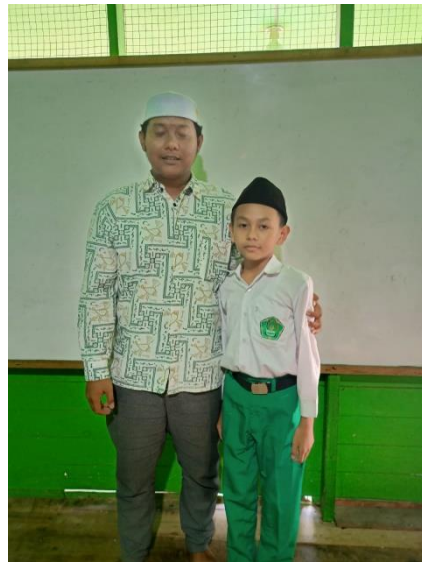
Foto Dokumentasi dengan Siswa Kelas V B MI Nur Rahman Kabupaten Banjar