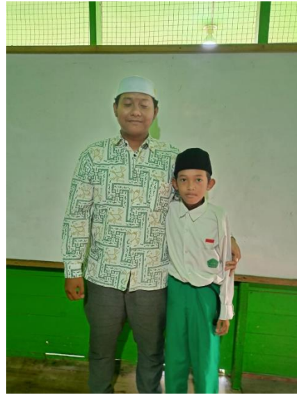
Foto Dokumentasi dengan Siswa Kelas V B MI Nur Rahman Kabupaten Banjar