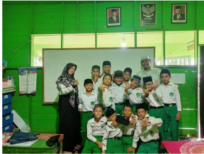
Foto Dokumentasi dengan Siswa Kelas V B MI Nur Rahman Kabupaten Banjar