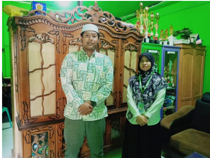
Foto Dokumentasi dengan Guru Kelas V B MI Nur Rahman Kabupaten Banjar