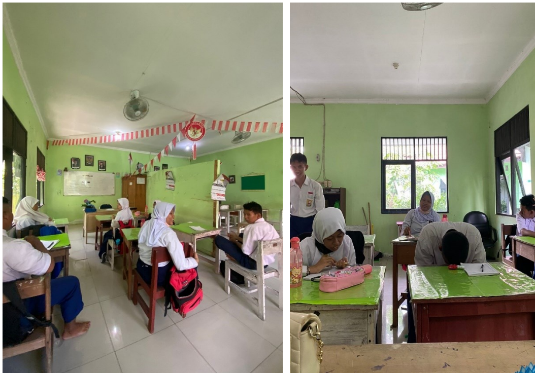
Dokumentasi proses pembelajaran