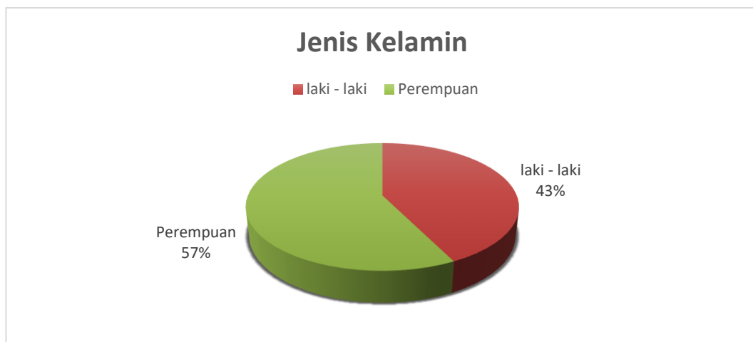
Gambar 4. 1 Diagram Data Berdasarkan Jenis Kelamin

Berdasarkan tabel 4.8 diperoleh jumlah responden penelitian berjenis kelamin laki-laki ada 84 mahasiswa dengan persentase sebesar 43% dan responden berjenis kelamin perempuan ada 113 mahasiswa dengan persentase sebesar 57%.