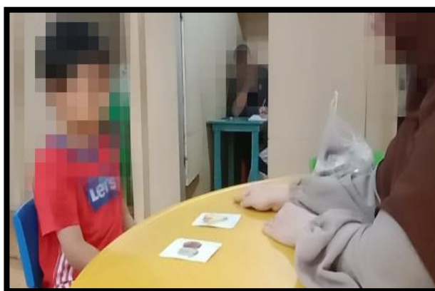
Gambar 4. 6 Pelaksanaan Discrimination Training pada Subjek YY dengan Identifikasi Buah. (CDFTSYY.1.2) 145