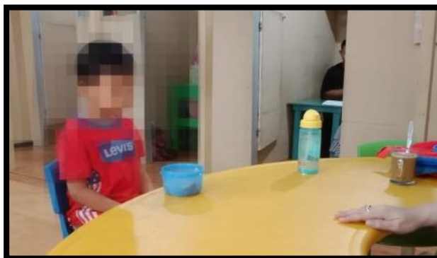
Gambar 4. 10 Pelaksanaan Chaining pada Subjek YY (CDFTSYY.1.5) 161

Tahap pelaksanaan chaining pada subjek YY terlihat pada gambar 4.10, dengan mempelajari perilaku kompleks yang dibagi menjadi aktivitas-aktivitas kecil seperti pada saat minum dari anak mampu membuka botol minum sendiri, setelah itu anak mampu minum sendiri. Adapun pada saat makan anak sudah mampu makan sendiri. Oleh karena itu, terapis mulai memahamkan dengan aktivitas bantu diri lainnya. (CLSY.2.9) 162 Penuturan terapis pada pengembangan diri anak, mulai berkembang dengan baik, makan dan minum sendiri sudah bisa, akan tetapi toilet training belum diajarkan. (CWT.1.7) 163