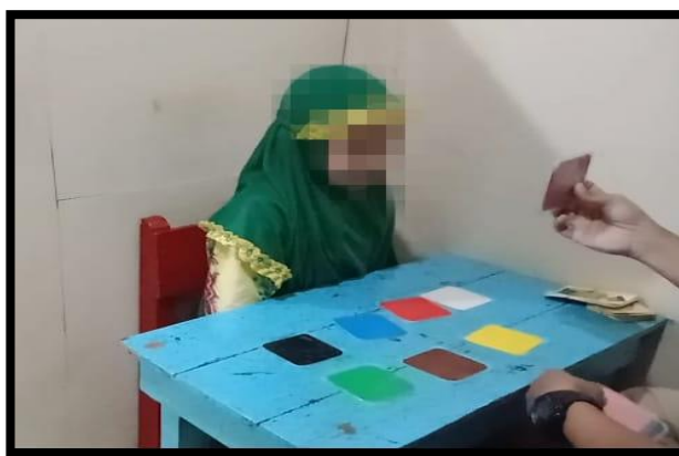
Gambar 4. 7 Pelaksanaan Discrimination Training pada Subjek SA dengan Identifikasi Warna. (CDFTSSA.2.4) 147

Tahap pelaksanaan discrimination training terlihat berbagai macam kartu warna pada gambar 4.7, terapis terlebih dahulu menanyakan satu per satu kartu sambil meletakkannya di atas meja. Setelah itu terapis menunjuk kartu warna