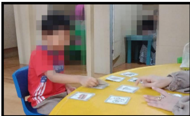
Gambar 4. 8 Pelaksanaan Matching /Mencocokkan pada Subjek YY dengan Kartu Alat Transportasi (CDFTSY.1.3) 150

Pelaksanaan matching /mencocokkan pada subjek YY terlihat pada gambar 4.8 menggunakan kartu gambar alat transportasi, dilakukan dengan cara terapis meletakkan beberapa gambar alat transportasi yang berbeda-beda diatas meja. Setelah itu terapis memberikan satu persatu gambar kembarannya dan memberikan instruksi pada anak “samakan”. Anak meresponnya walaupun masih dalam bantuan penuh oleh terapis. (CLSY.2.6) 151