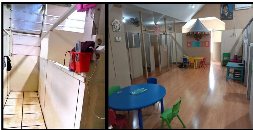
Gambar 4. 14 Ruang Terapi Individual Lantai 1 dan 2 (CDFSDP.6.8) 198 dan (CDFSDP.6.14) 199