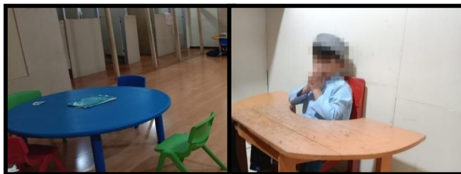
Gambar 4. 5 Ruang Terapi Subjek AP (CDFTSAP.3.1) 130

Penggunaan ruang terapi subjek AP terlihat pada gambar 4.5 terdapat dua ruang terapi yang berbeda, karena anak diampu oleh 2 orang terapis secara selang-seling bergantian, menyesuaikan dengan tempat terapisnya. Jika belajar bersama terapis ibu M anak terapi di area klasikal lantai 2 dan jika bersama terapis bapak B anak terapi di ruang individual lantai 1. Adapun di dalam ruangnya dilengkapi dengan meja, kursi dan lemari, terdapat penerangan yang cukup, ventilasi dan suhu ruangan yang nyaman serta hiasan dinding yang tidak mencolok. (CLSAP.1.2) 131