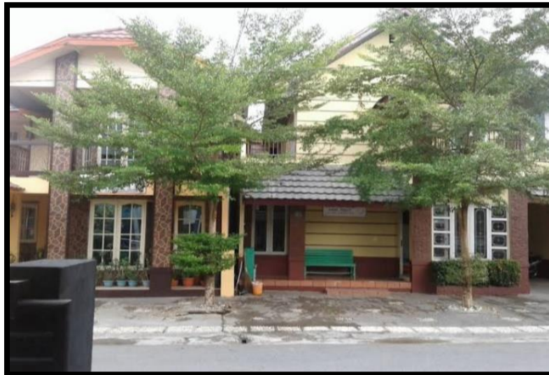
Gambar 4. 1 Gedung Pondok Terapi Autisma Anak Manis (CDFSDP.6.1) 94

Sebelum peneliti memaparkan data mengenai perencanaan, pelaksanaan, dan evaluasi penanganan anak autisme melalui terapi perilaku ABA di Pondok Terapi Autisma Anak Manis Banajrmasin, peneliti akan memberikan gambaran umum mengenai lokasi penelitian di tempat tersebut. Berikut merupakan deskripsi mengenai lokasi penelitian dan tampak depan gedung terapi yang dapat dilihat pada gambar 4.1 di bawah ini.