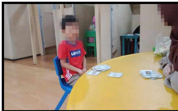
Gambar 4. 3 Area Terapi Subjek YY (CDFTSY.1.1) 125

Pada gambar 4.3 terlihat penggunaan ruang terapi subjek YY berada di lantai 2 tepatnya di tengah-tengah ruangan (area terapi klasikal belakang) dan dilengkapi 1 meja besar dan 4 kursi. Adapun penerangan ruangan terapi, ventilasi dan suhu ruangan yang nyaman, karena terdapat fasilitas yang memadai. Tidak ada hiasan dinding yang terlalu mencolok, hanya ada hiasan dinding untuk pengenalan angka. Dalam satu ruangan tersebut terdapat juga sembilan ruang terapi individual yang bersekatkan antar ruangnya setengah dinding terbuka, didalam ruangnya dilengkapi 1 meja, 2 kursi, 1 lemari dinding atas untuk penyimpanan perlengkapan media pembelajaran. Serta terdapat 1 area terapi klasikal depan yang juga dilengkapi 1 meja besar dan 4 kursi. (CLSYY.1.2) 126