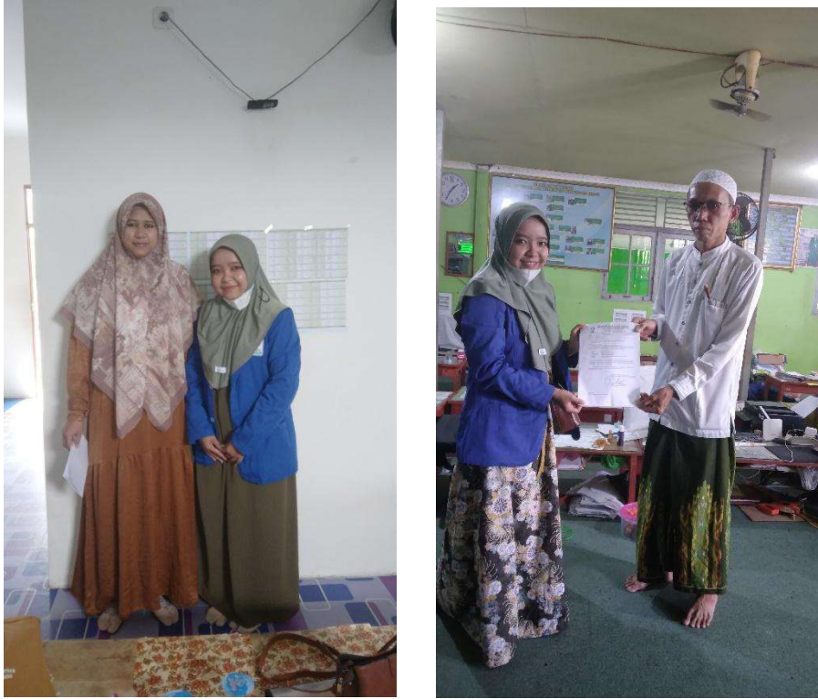
Gambar 1 dan 2. Wawancara bersama ustadzah dan pengasuh pondok di Pondok Pesantren Nurul Jannah Banjarmasin