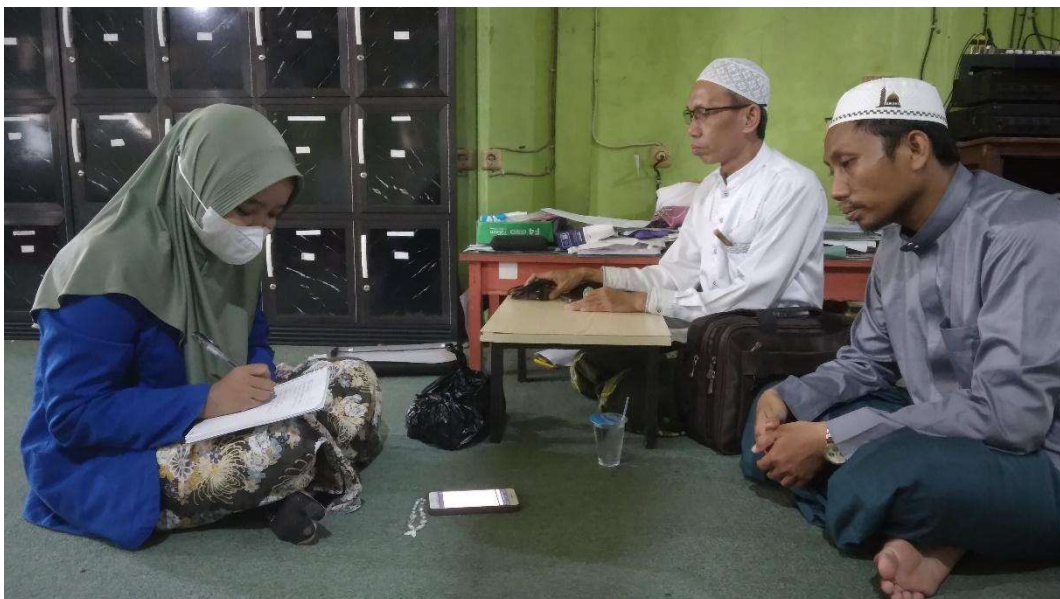
Gambar 3. Wawancara bersama wakil bidang kurikulum Pondok Pesantren Nurul Jannah Banjarmasin