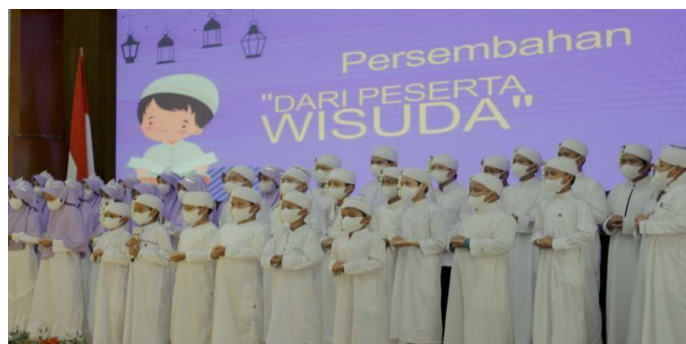
Gambar 4.8 Wisuda Tahfiz

Santri yang menyelesaikan hafalan Alquran minimal satu juz atau juz 30 boleh diikutkan wisuda tahfidz.