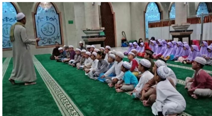
Gambar 4.6 Morning Pray

Morning pray merupakan sebuah program yang diadakan dengan tujuan untuk menanamkan pentingnya beribadah di waktu pagi kepada santri/wati. Tidak hanya kegiatan keagamaan, program ini juga di tunjang dengan kegiatan positif lainnya. Kegiatan dimulai dari pukul 04.00 WITA dini hari dengan sholat Tahajjud berjama'ah diikuti sholat hajat serta sholat taubat, kemudian dilanjutkan dengan sholat Subuh berjama'ah di Masjid, tadarus Qur'an bersama, muhasabah session, tausiyah, senam pagi dan di tutup dengan do'a serta makan bersama.