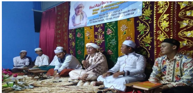
Gambar 4.7 Peringatan Hari Besar Islam

Peringatan hari besar Islam yang sering diperingati di Rumah Quran At-Taisir Sungai Andai Banjarmasin adalah peringatan Maulid Nabi Muhammad Saw. dan Isra Mi'raj. Hal ini bertujuan untuk membuat santri tahu mengenai sejarah-sejarah besar dalam Islam.