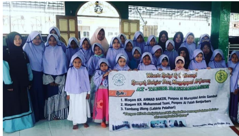
Gambar 4.5 Dokumentasi Rihlah