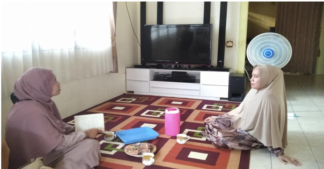
Gambar 4.15 Dokumentasi Wawancara