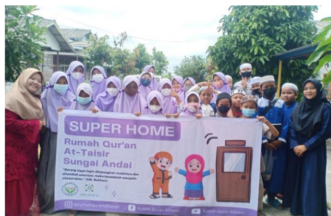
Gambar 4.3 Program Super Home

Super Home merupakan sebuah program pembelajaran yang dilakukan dengan mengunjungi salah satu rumah santri. Program ini bertujuan untuk menjalin silaturrahim antara guru, santri dan orangtua santri yang diisi dengan sholat dhuha berjama'ah, tadarus Qur'an dan muroja'ah hafalan serta di selingi dengan games dan ditutup dengan Do'a sekaligus makan bersama.