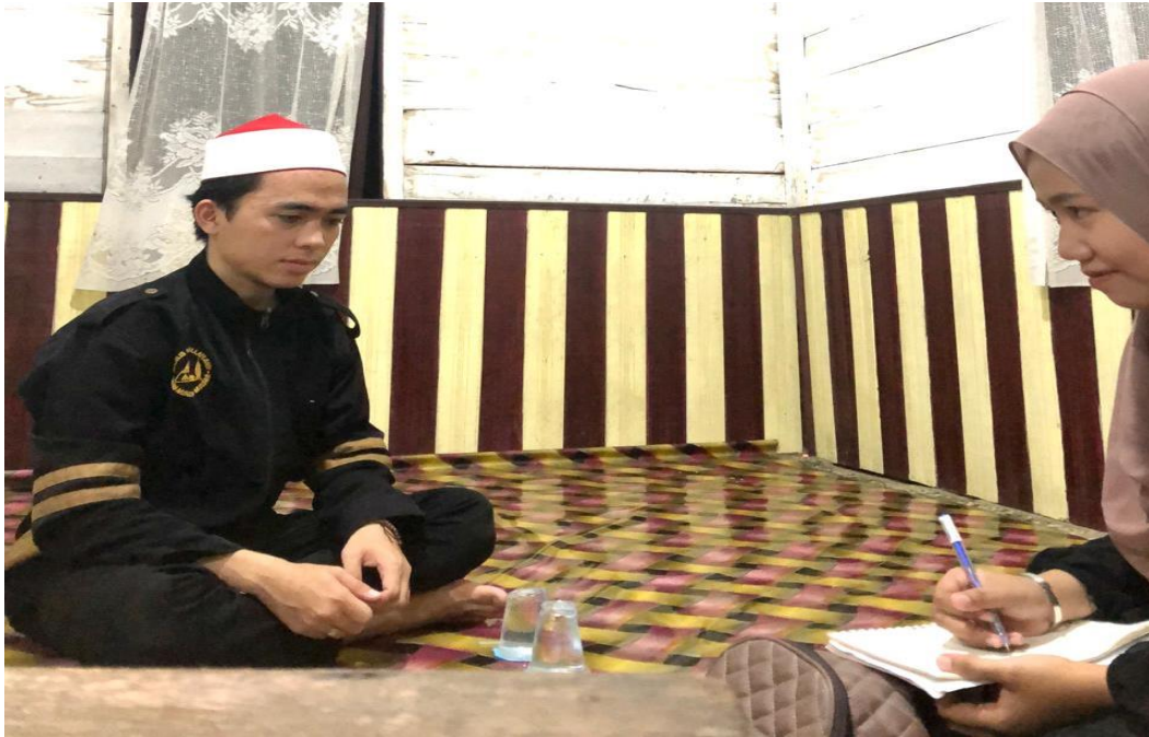
Gambar 4.13 Dokumentasi Wawancara