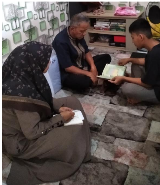
Gambar 4.17 Dokumentasi Wawancara