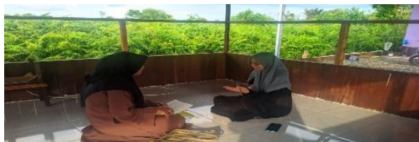
Gambar 4.9 Dokumentasi Wawancara