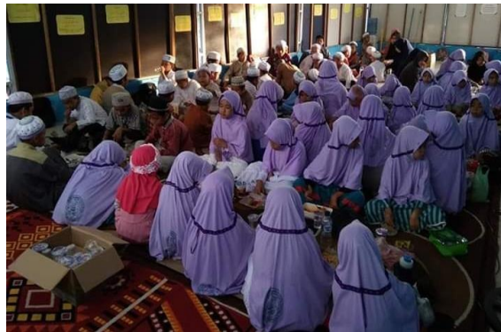
Gambar 4.4 Puasa Sunnah dan Buka Bersama

Salah satu program penunjang di Rumah Quran At-Taisir Sungai Andai Banjarmasin adalah puasa sunnah dan buka bersama. Program ini bertujuan untuk melatih santri agar terbiasa berpuasa. Bagi sebagian anak-anak puasa terasa berat karena harus menahan lapar dan haus. Di Rumah Quran At-Taisir Sungai Andai santri dibiasakan untuk berpuasa sunnah. Hal ini agar santri tidak merasa sendirian dan membuat malas untuk berpuasa, makanya program ini untuk membuat santri termotivasi untuk berpuasa sunnah dan teman-temannya pun puasa sunnah jadi membuat santri semangat.