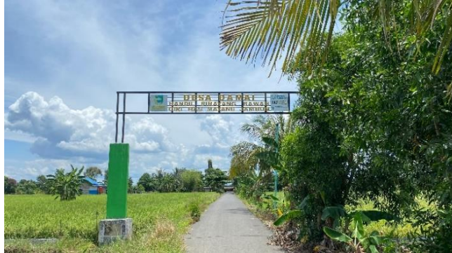
Gapura Desa Damai