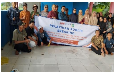
Pelatihan Public Speaking