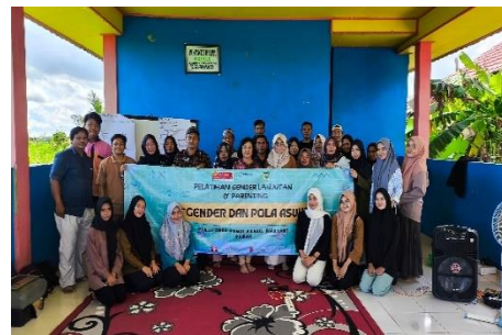
Pelatihan Gender dan Pola Asuh