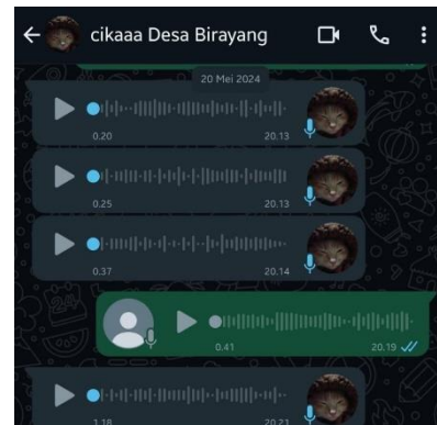
Wawancara dengan Cika