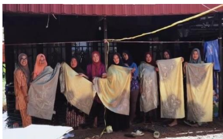
Pelatihan Pewarnaan Sasirangan