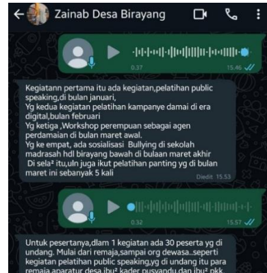
Wawancara dengan Zainab