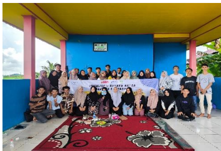
Sosialisasi NAPZA dan Sex Education