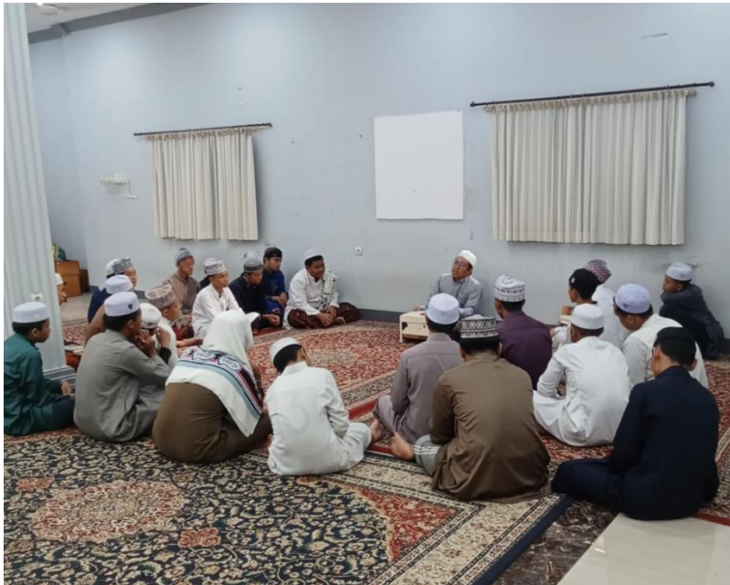
Gambar. 11 Muhasabah Sebelum Tidur