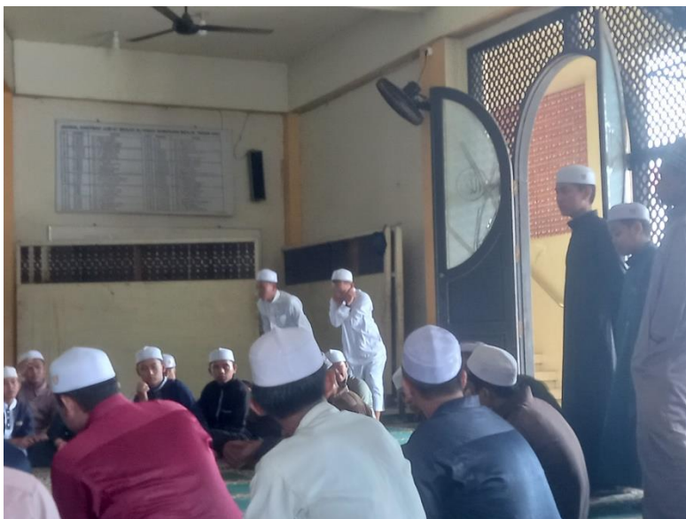
Gambar.8 Muhasabah setelah Program Dzikir