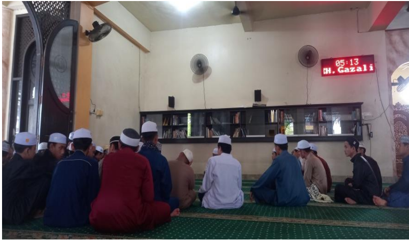
Gambar.10 Qiraatul Kutub