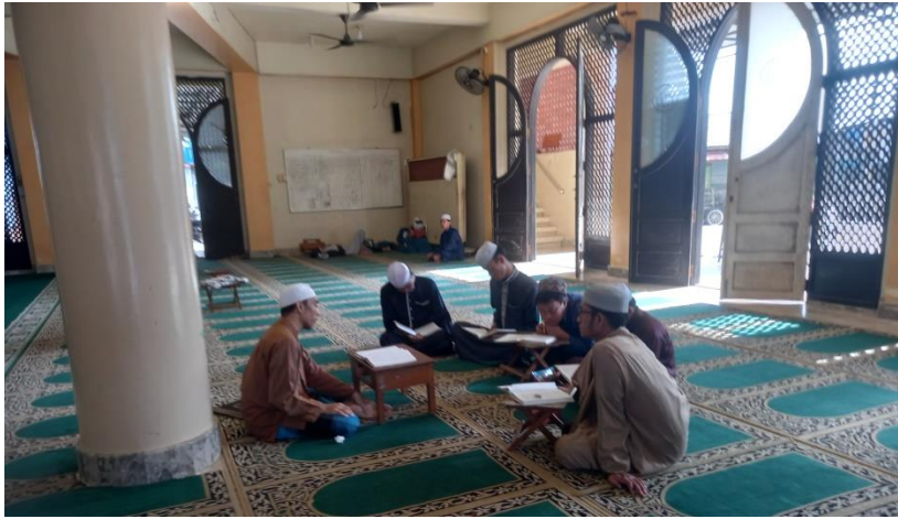
Gambar 12. Ta'limul Kutub