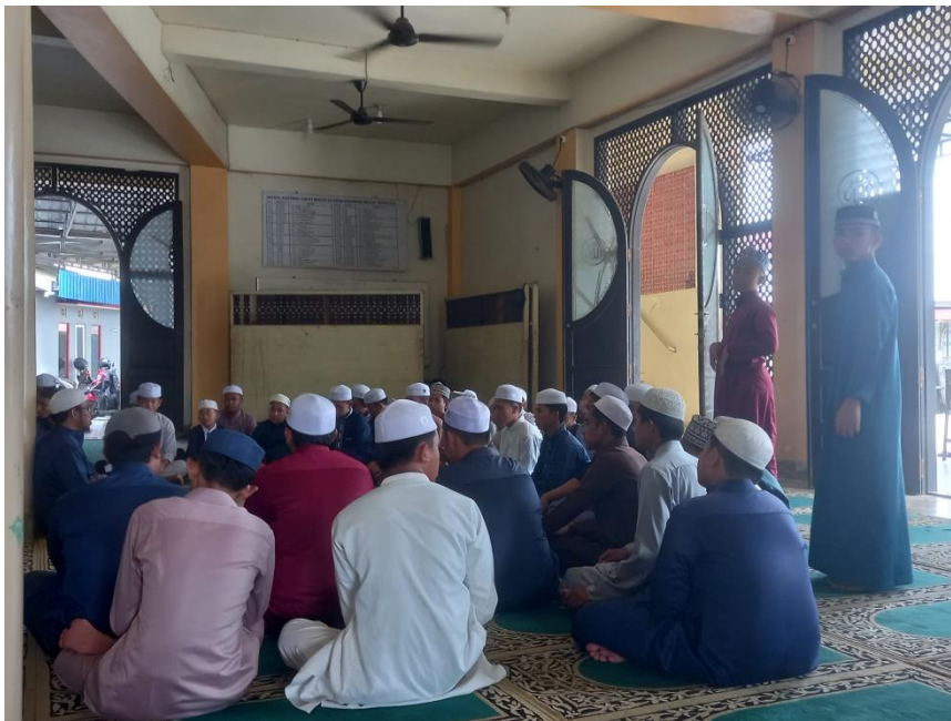
Gambar.7 Program Dzikir