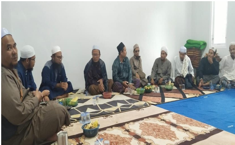
Gambar.13 Rapat Musyawarah Bulanan