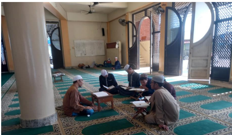
Gambar 12. Ta'limul Kutub