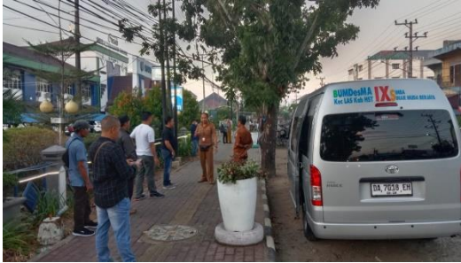
Mobil Mini Bus Milik BUM Desa Bersama