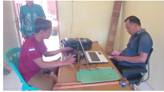
Wawancara Dengan Pendamping Desa