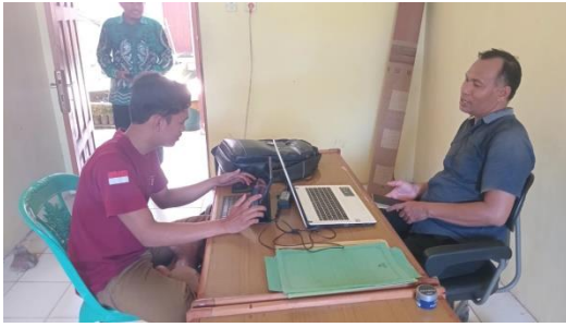
Wawancara Dengan Pendamping Desa