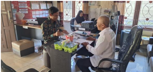
Wawancara Dengan Kepala Desa