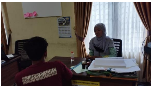
Wawancara Dengan Pemda Ahli BUM Desa