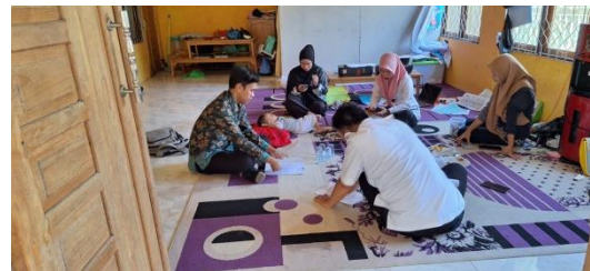
Wawancara Dengan Kepala Desa