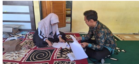
Wawancara Dengan Kepala Desa