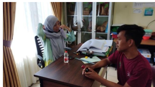
Wawancara Dengan Pemda Ahli BUM Desa