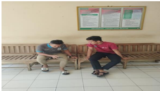
Wawancara Dengan Sekretaris BUM Desa Bersama