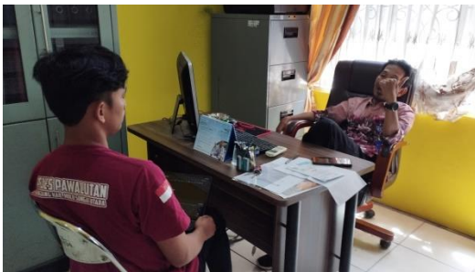
Wawancara Dengan Pemda Ahli BUM Desa