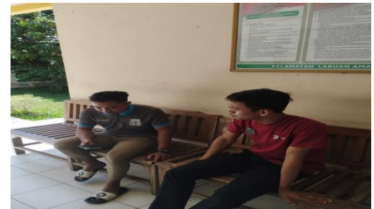
Wawancara Dengan Sekretaris BUM Desa Bersama