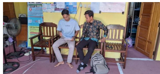
Wawancara Dengan Kepala Desa