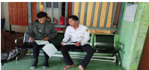
Wawancara Dengan Kepala Desa