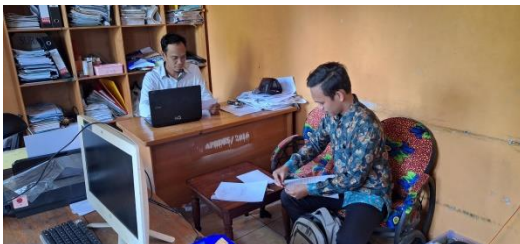
Wawancara Dengan Kepala Desa