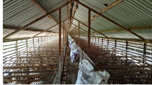
Kandang Itik Petelor BUM Desa Bersama