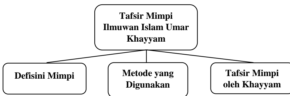
Gambar 4.2 Konsep Analisis Mimpi Umar Khayyam

dalam perspektif Islam mengenai mimpi. Berikut adalah gambaran konsep analisis mimpi oleh Umar Khayyam.