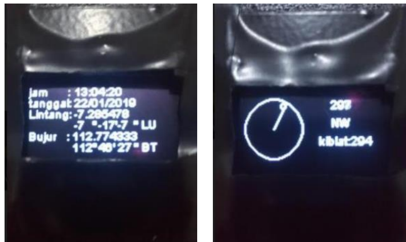
Gambar 1.4 GPS Kompas Kiblat

Hasil pengujian alat penunjuk kiblat GPS yang dibandingkan dengan kompas menunjukkan bahwa penggunaan alat di dalam ruangan menghasilkan nilai rata-rata deviasi sebesar 5,875^\circ dan pada kondisi di luar ruangan menghasilkan nilai rata-rata deviasi sebesar 2,375^\circ . 25 Hal ini menunjukkan bahwa penggunaan alat sebaiknya dilakukan di luar ruangan agar nilai azimuth mendekati nilai dari kompas.