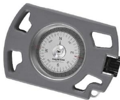
Gambar 1.2 Kompas Brunton degree-360/R/QUADS/MILS

Kompas Brunton dan Kompas Suunto termasuk kategori kompas yang memiliki akurasi cukup tinggi dibandingkan dengan kompas-kompas lainnya. Kompas Brunton dibuat oleh USA, merupakan alat yang digunakan dalam berbagai kegiatan survei, dan dapat menentukan arah azimuth, mengukur besarnya sudut suatu lereng dan menentukan ketinggian suatu titik (tempat).