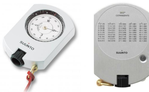
Gambar 1.3 Kompas Suunto KB-14

Untuk pengujian akurasi kedua kompas tersebut, Muhammad Hidayat menggunakan metode komparasi dengan pengukuran azimuth panduan Matahari menggunakan teodolit, rol busur, data azimuth matahari, data deviasi magnetik Kota Medan dengan lokasi Observatorium Ilmu Falak Universitas Muhammadiyah Sumatera Utara pada hari Sabtu, 07 Januari 2023/ 14 Jumadil Akhir 1444 H pukul 08:00 s.d. 09:30.