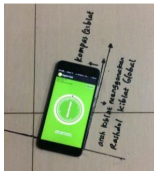
Gambar 1.5 Kompas Kiblat Digital Falak Berbasis Android

Selanjutnya, penelitian terhadap akurasi kompas kiblat menggunakan aplikasi berbasis Android juga dilakukan oleh Zahrotun Niswah. Kompas kiblat berbasis Android ini diuji akurasinya dengan cara membandingkannya dengan hasil pengukuran azimuth kiblat menggunakan teodolit dan hasil pengukuran saat Matahari di atas Ka'bah ( rashd al-qiblah ). Hasil penelitian menyimpulkan bahwa Kompas kiblat berbasis Android ini masih terdapat deviasi sebesar 3^{\circ} - 6^{\circ} dibandingkan hasil pengukuran menggunakan teodolit. 26