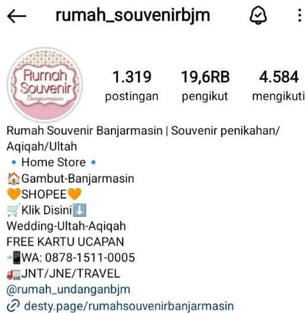
Gambar 1.1 Instagram usaha Rumah Souvenir Banjarmasin.

pengguna. Jenis produk yang tersedia pun sangat beragam, diantaranya adalah tasbih, sajadah travel, handuk, gelas, mangkok, tumbler, kipas dan masih banyak lagi. Selain itu usaha ini juga menyediakan jasa pembuatan kartu undangan digital dengan berbagai desain yang menarik. Rumah Souvenir Banjarmasin menjalankan bisnis secara online. Pelaksanaan pemasaran secara online dilakukan melalui sosial media dan marketplace seperti instagram, tiktok dan shopee. Pemasaran melalui digital tersebut dapat menjangkau konsumen secara lebih luas, ditambah dengan menerapkan strategi digital marketing yang mengikuti perkembangan zaman maka dapat meningkatkan penjualan produk pada Rumah Souvenir Banjarmasin.