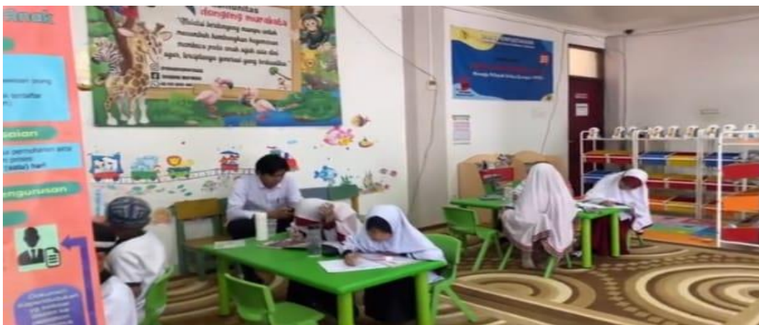
Ruang Perpustakaan Anak