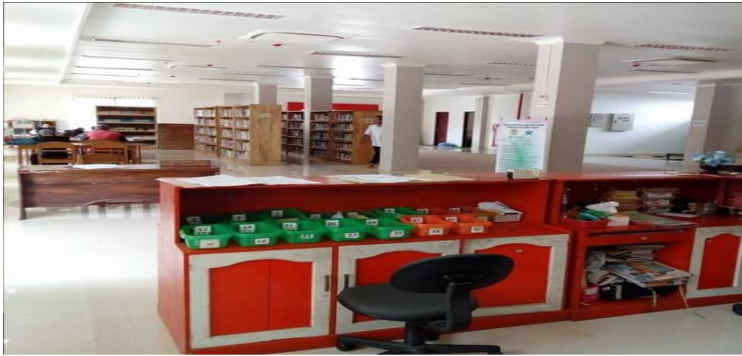
Ruang Sirkulasi (Ruang Peminjaman atau Pengembalian Buku)