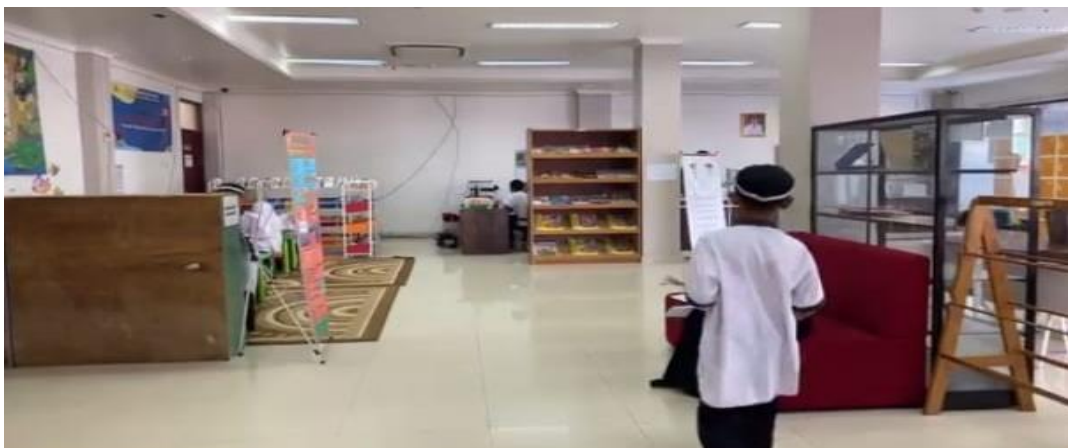
Ruang Dinas Perpustakaan Kabupaten Hulu Sungai Tengah