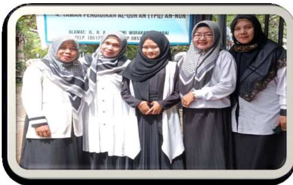
Bersama Dewan Guru Kelompok B1 & B2