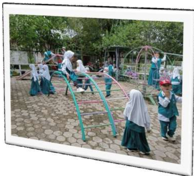
Kegiatan Bermain APE luar atau istirahat