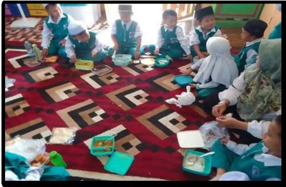
Kegiatan Makan Bekal Bersama