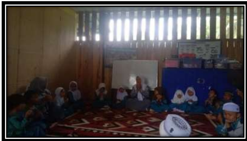
Kegiatan Persiapan Pulang Berdoa dan bersalaman