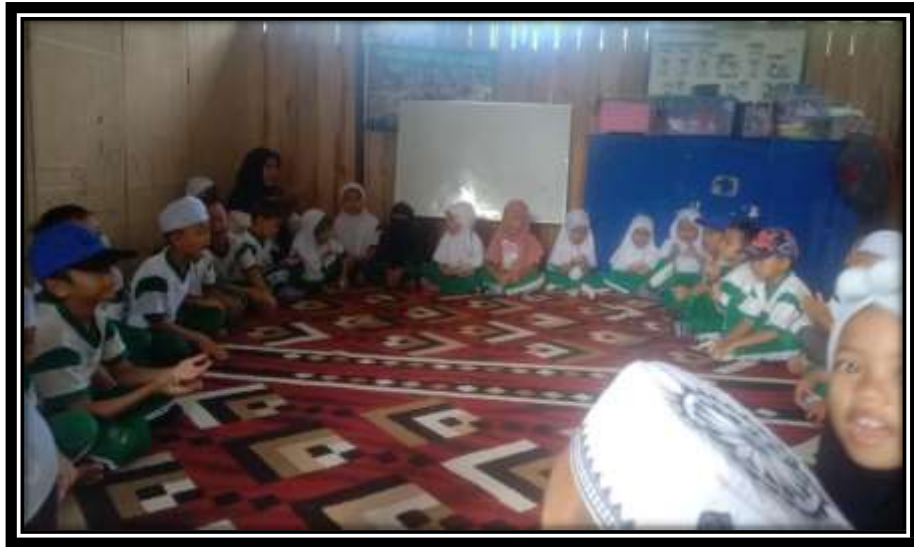
Kegiatan Awal Berdoa, Membaca Surah-surah pendek, dll