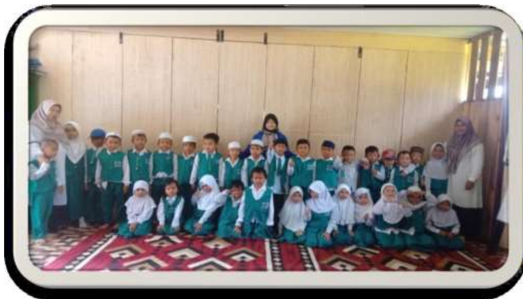
Bersama Anak-anak dan Guru Kelompok B1