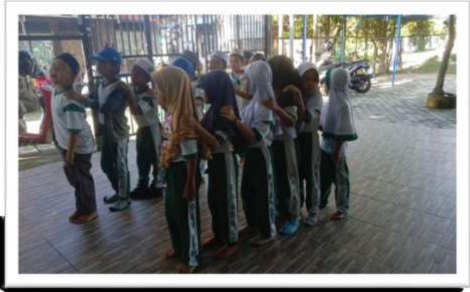
Kegiatan sebelum masuk kelas