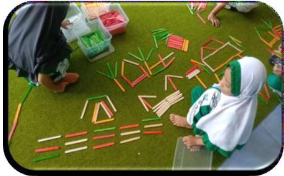
Kegiatan Inti Berkreasi dengan Bermain Loose Parts

Bekas Tutup Botol dan Stik Es Krim membuat bentuk rumah, tanaman, jalan jembatan, kapal laut, kapal layar dan pesawat terbang