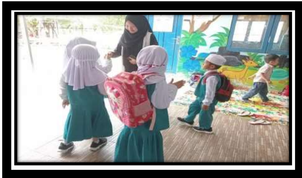
SOP Penyambutan Anak-anak baru datang bersalaman sambil mengucap salam sebelum menyimpan tasnya