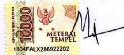
Muhammad Fathur Rahman

Banjarmasin, 2 September 2024 Yang membuat pernyataan,